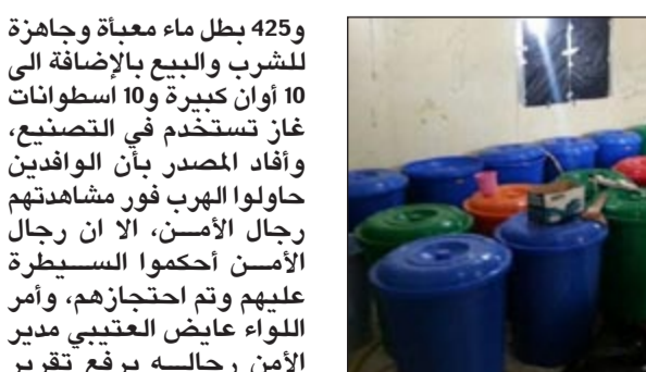
الخمور المضبوطة في مصنع الوفرة

الجنسية البنغالية، وعثر داخل المصنع على 38 برميلا