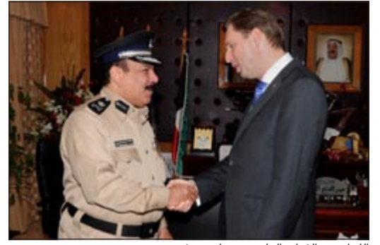
اللواء عبدالفتاح العلي مرحبا بضيفه

استقبل مدير عام الإدارة العامة للمرور اللواء عبدالفتاح عبدالمحسن العلي الممثل المقيم لبرنامج الأمم المتحدة الإنمائي في الكويت ستين هنسن، وقد نقل إليه تحيات النائب الأول لرئيس مجلس الوزراء ووزير الداخلية الشيخ أحمد الحمود كما شكره على هذه الزيارة مؤكداً له الاهتمام بتنفيذ المرحلة القادمة من الاستراتيجية 2014 - 2020م. وقد تناول اللقاء سير انجاز مشروع الإستراتيجية الوطنية للمرور وقطاع النقل 2010 - 2020 الذي تشرف عليه الإدارة العامة للمرور بالتعاون مع برنامج الأمم المتحدة الإنمائي من قبل الأمانة العامة للمجلس الأعلى للتخطيط والتنمية استناداً لقرار مجلس الوزراء المؤرخ رقم «1426» في أكتوبر 2010 كما تم الاتفاق على أن تتواصل هذه الاجتماعات للاستعجال في تنفيذ المشاريع المتعلقة بالإستراتيجية بما يخدم خطط الدولة وتلبية متطلبات المجتمع.