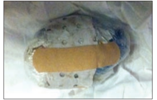
لغلاف حشيش عثر عليها أسفل كرسي داخل قفص المحاكمة

أوقف رجال امن حولي شابين: مواطن وخليجي في منطقة السالمية يوم أمس وكان بحوزتهما حبوب مخدرة وقطعة حشيش وأسلحة بيضاء وتم احالة المتهمين الى الادارة العامة لمكافحة المخدرات بأوامر من مدير الأمن العميد غلوم حبيب. وقال مصدر امني ان دورية تابعة لأمن حولي كانت في جولة اعتيادية داخل منطقة السالمية واشتبه رجلها بمركبة أميركية كان قائدها يترنح بين حارات الطريق وعليه تم توقيف قائد المركبة وتبين انه مواطن وبرفقته شاب خليجي وظهرت عليهما علامات الارتباك وبتفتيش الشابين احترازيا تم العثور معهما على كمية من الحبوب المخدرة بالإضافة إلى قطعة اشتبه بانها من مادة الحشيش وكذلك أسلحة بيضاء وباخطار العميد غلوم أمر رجاله برفع تقرير وإحالة الشابين إلى المكافحة. من جهة أخرى عثر رجال أمن السجن المركزي صباح أمس على كميات من المواد المخدرة تخلص منها نزل قبل نقلهم إلى قصر العدل وقال مصدر أمني ان المخدرات المضبوطة كانت عبارة عن حشيش ومؤثرات عقلية.