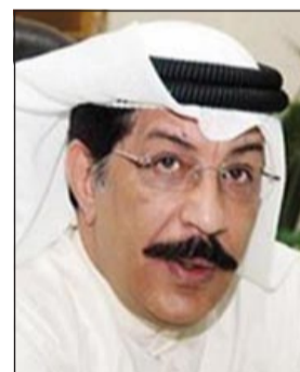
اللواء عبدالحميد العوضي

الي جانب مجاورة الكويت دولا تعاني من عدم الاستقرار