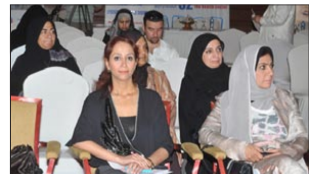
جانب من الحضور بالمؤتمر