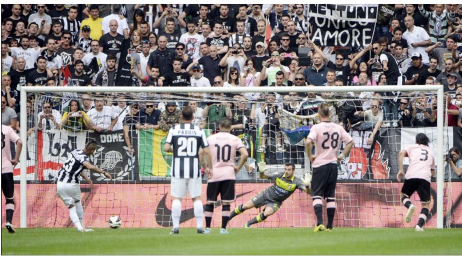
فيدال سجل هدف الفوز ليوقنتوس من ضربة جزاء ليهدي لقب الكالتشيو للسيدة العجوز

احتفظ يوقنتوس بلقب بطل الدوري الإيطالي لكرة القدم قبل ثلاث مراحل على انتهاء الموسم، وذلك بفوزه على ضيفه باليرمو 0-1 أمس في المرحلة الخامسة والثلاثين. ونجح فريق «السيدة العجوز» في تحقيق أكثر مما هو مطلوب منه، فخرج بالنقاط الثلاث واحتفل باللعب بأفضل طريقة بين جماهيره، وذلك بعد أن حقق فوزه الثامن على التوالي بفضل التشيلي ارتورو فيدال الذي سجل هدف المباراة الوحيد. ورفع يوقنتوس رصيده الى 83 نقطة في الصدارة بفارق 14 نقطة عن ملاحقه نابولي، وعلى ملعب «سان سيرو» فاز ميلان على ضيفه تورينو بفصل هدف سجله ماريو بالوتيلي، وفاز أوبينيزي على ضيفه سميدوريا 3-1، بينما اكتسح لاتسيو ضيفه بولونيا بستة أهداف نظيفة، وأصبح بيسكارا أول الفرق الهابطة رسميا الى الدرجة الثانية بخسارته امام مضيفه جنوى 4-1.