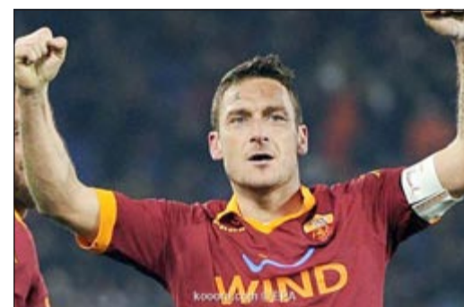
نجم روما توتي

أكد مهاجم نادي روما الإيطالي وقائده فرانثيسكو توتي ان فريقه قادر على اقتناص المركز الثالث المؤهل لدوري أبطال أوروبا الموسم المقبل، وذلك بعد نجاح الفريق في تحقيق الفوز على فيورنتينا على ملعب ارتيميو فرانكي بمدينة فلورنسا بهدف دون مقابل احرزه المهاجم أورفالو في الوقت بدل الضائع. وقال توتي لشبكة سكاى سبورت «هذه المباريات تثبت أننا قادرون على ان نقول كلمتنا حتى ولو في الوقت بدل الضائع، سنحاول ان ننهى الموسم بأفضل طريقة ممكنة». وأضاف توتي «الموسم لم ينته بعد، علينا اللعب بكامل قوتنا البدنية والذهنية حتى ننهى الموسم بشكل جيد، المنطق يتحدث عن فرصنا الكبيرة في التاهل للدوري الأوربي ولكني واقف في قدرتنا على المنافسة على المركز الثالث المؤهل لدوري الأبطال، ولا ننسى ايضا ديربي نهائي الكأس».