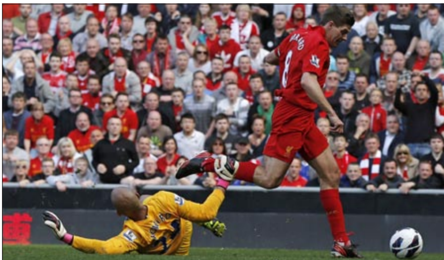
نجم ليفربول ستيفن جيرارد يهدر فرصة للتهديف أمام تيم هاوارد حارس إفرتون