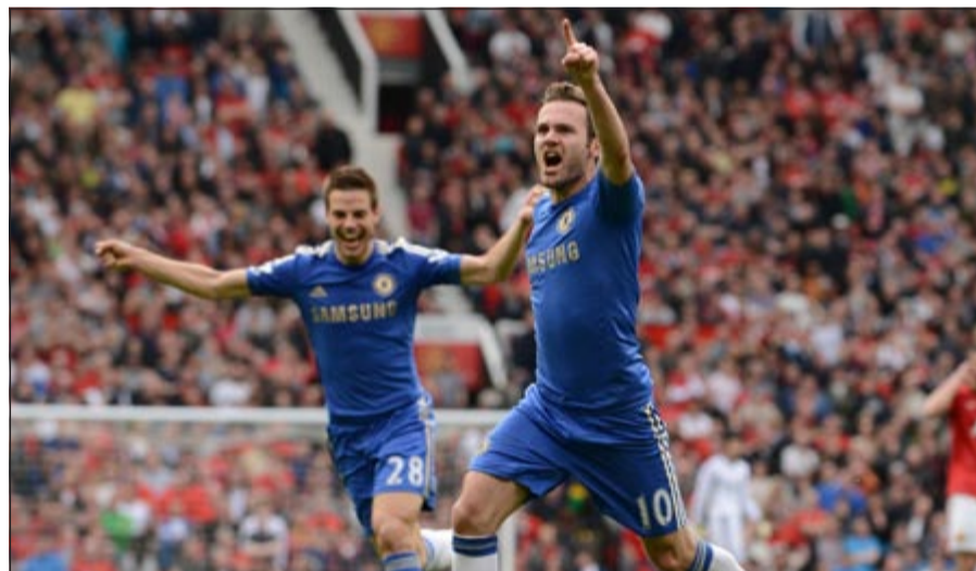
فرحة خوان ماتا بهدف الفوز لتشلسي في مرمى مان يونايته (رويترز)