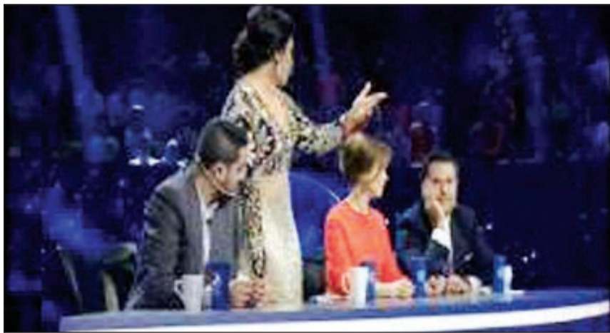
لحظة مغادرة أحلام

الأكثر صعوبة، وأكد راجب انه يسرى أن برنامج أراب آيدول هذا الموسم يمتلك أكبر عدد من الاصوات الجميلة بين كل البرامج الموجودة. قدمت أربع مشتركات ميدلي للفنانة سميرة سعيد واغنيات اخرى لها ثم اطلت سعيد على المسرح وقدمت بنفسها أغنية تفاعلت معها لجنة الحكم كما الجمهور. ورحبت اللجنة بسعيد واعتبرت ان وجودها في البرنامج كضيفة «شرف كبير» وهي بنفسها عبرت عن محبتها الكبيرة لكل من راجب واحلام ونانسي وحسن واعتبرت ان «لجنة التحكيم في أراب آيدول هي اللجنة الأكثر حفة ظل بين كل لجان التحكيم».