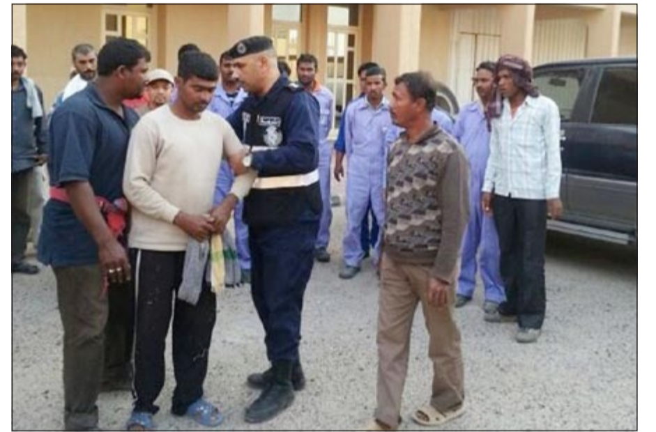
ضبط المخالفين وإحالتهم إلى جهة الاختصاص