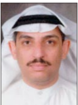
المستشار محمد الخلف

عن تهمة الطعن في حقوق الأمير وسلطته والعيب في الذات الأميرية. وقد برأت المحكمة المتهمه من تهمة إذاعة بيانات كاذبة ومغرضة بالخارج من خلال صفحاتها على برنامج «تويتر». ورفضت المحكمة الدفع المبدى من دفاع المتهمه بعدم اختصاص القضاء الكويتي ولاثيا بنظر الدعوى.