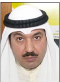
المستشار أنور العنزي

تم ضبط يوم أول من أمس كمية كبيرة تقدر بـ 10 أطنان من الألبان الفاسدة المنتهية الصلاحية وذلك خلال حملة مفاجئة من قبل مفتشى بلدية الجهراء بالتعاون مع رجال الأمن. وقال مصدر أمني أن حملة مفاجئة