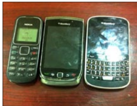
المسروقات التي تم العثور عليها مع الحدين

لم تمض 24 ساعة على سرقة نحو 18 مركبة من مواقف مستشفى الجهراء وذلك بتعليمات من مدير أمن محافظة الجهراء اللواء إبراهيم الطراح ليتم ضبط الجناة وهما مواطنان تم القبض عليهما بكمين من قبل رجال الأمن والمباحث وقد اعترف الشابان بسرقة نحو 30 مركبة بالتحقيقات الأولية. وقال مصدر أمني له الأبناء» التي أشارت في عددها يوم أمس إلى عملية السرقة أن رجال الأمن بقيادة قائد منطقة الجهراء العقيد صلاح الدعاس ومدير مباحث الجهراء العقيد سعد العدوانى شكلوا فرقة لعمل كمين في مواقف مستشفى الجهراء بعد السرقة مباشرة ليتم تعقب شاخين قام أحدهما بوضع «جيس» من القماش على ساقه للتظاهر بأنه مصاب، وتمت مراقبته من قبل الرائد بدر البطاح والقاء القبض عليه والتوجه به إلى المستشفى ليوضح أن ليس به أي نوع من الكسور وأنه يدعى الإصابة ليتم إحالتهم إلى التحقيق، حيث اعترف المتهمان وهما مواطنان بأنهما قاما بكسر زجاج نحو 30 مركبة والاستيلاء على هواتف نقالة ومبالغ مالية.