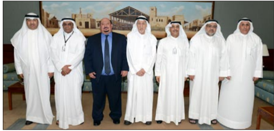
عبدالعزیز العدساني مع مصطفى البراري والوكلاء المساعدين في الديوان

والحاسبة. وشدد على ضرورة تعزيز وتنمية التعاون المهني بين أجهزة الرقابة العربية لرفع مستوى كفاءة الأجهزة الرقابية العربية وأداء دورها على أكمل وجه في حماية المال العام داعيا إلى فتح آفاق التعاون بين الجانبين (الكويتي-الأردني) عبر المشاركة في اللقاءات التدريبية وورش العمل وتبادل