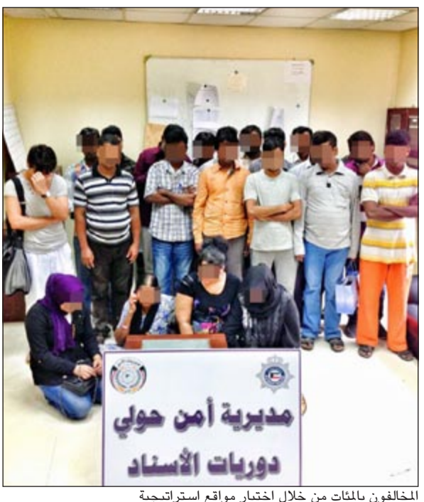
المخالفون بالمئات من خلال اختيار مواقع استراتيجية