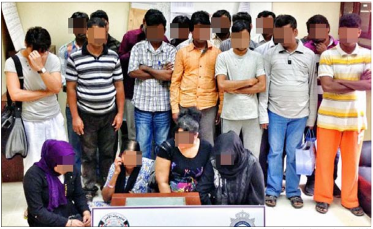
الأوكار المشبوهة حصيلتها نساء ورجال وسماسرة آسيويون