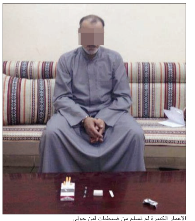
الأعمار الكبيرة لم تسلم من ضبطيات أمن حولي