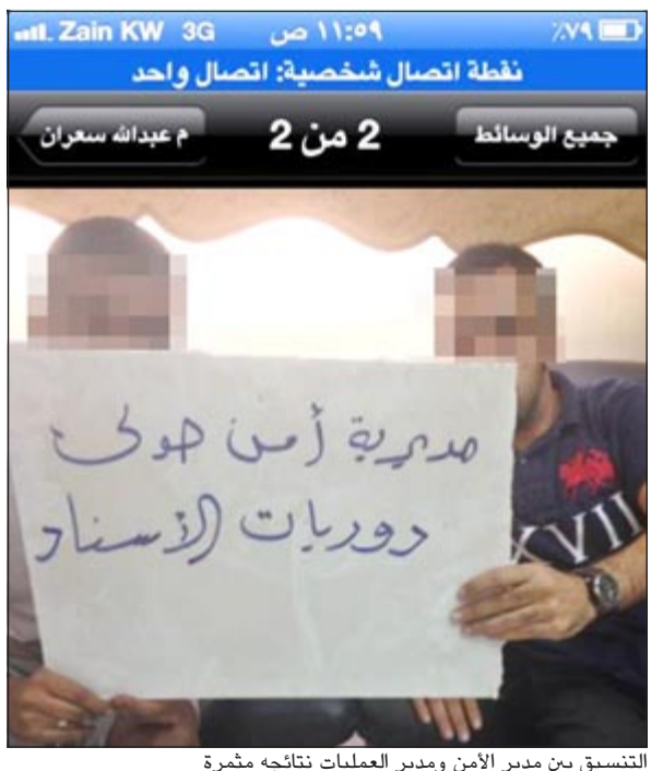
التنسيق بين مدير الأمن ومدير العمليات نتائجه مثمرة