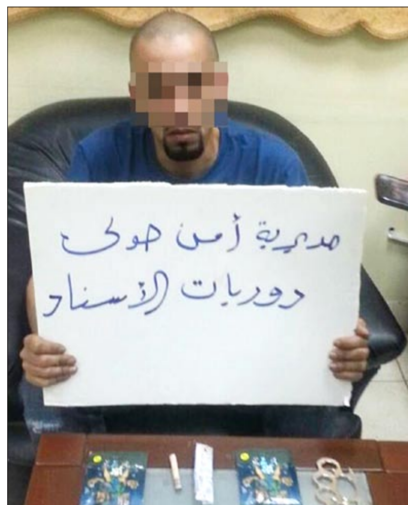
أمن حولي احتل الترتيب الأول في الضبطيات