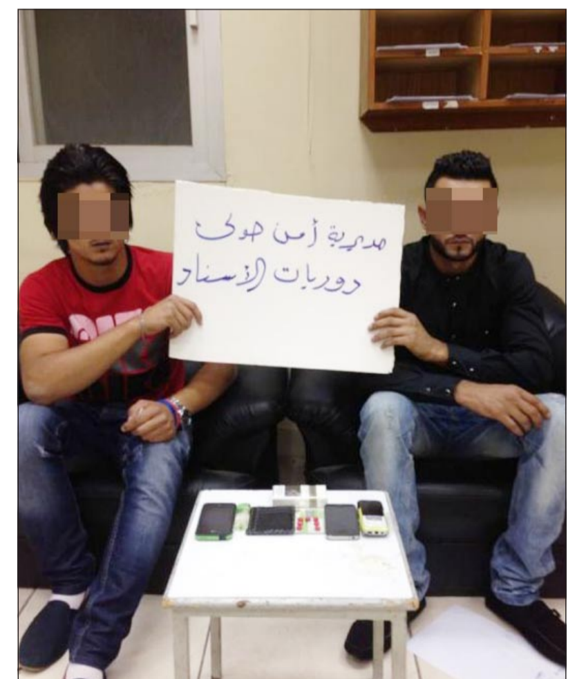
إحدى ضبطيات المواد المخدرة التي ضبطت من قوى أمن حولي