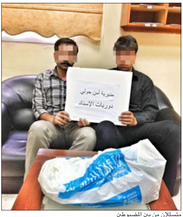
متسللان من بين المضبوطين