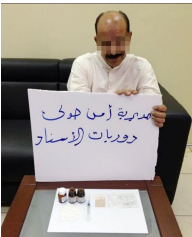
حبوب ومؤثرات عقلية من بين المضبوطات