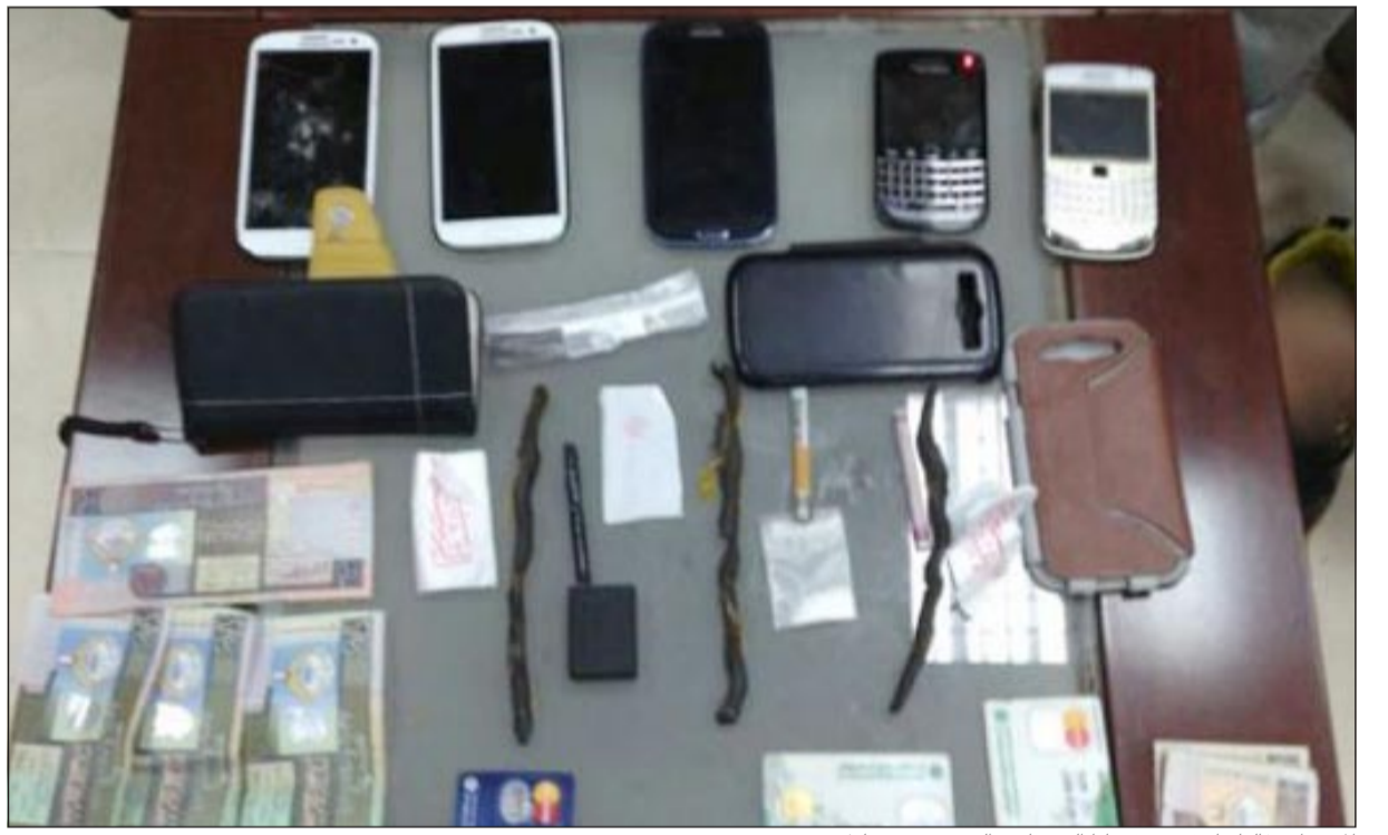
المخدرات غالبا ما تفتقر بقضايا السرقات والصورة خير دليل