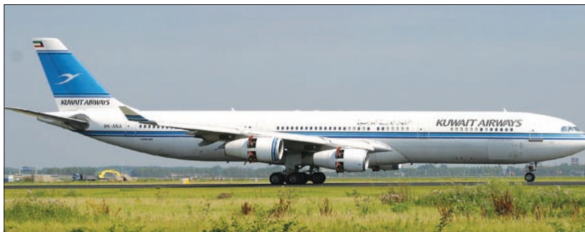
كيف تجذب خصخصة الشركة المستثمر الجديد في ظل خسائر سنوية بـ 100 مليون دينار؟

مع وجود ديون كبيرة قائمة على الشركة حالياً،