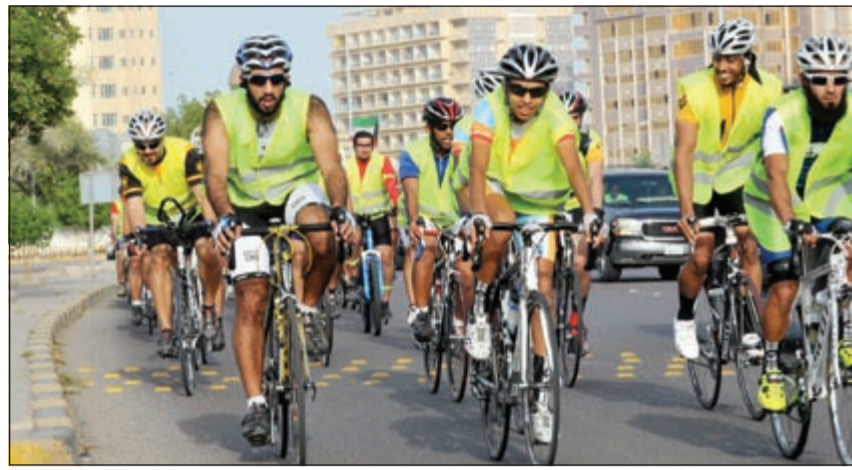
مجموعة من المتسابقين أثناء الماراثون