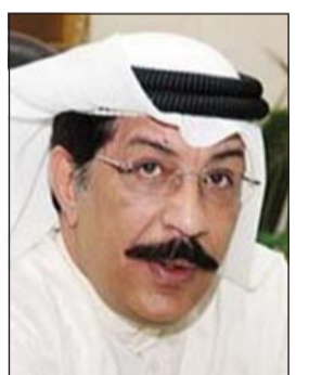
اللواء عبدالحميد العوضي

قبل ماфия المواد المخدرة لارتفاع مستوى دخل الفرد فيها، ونحن لهؤلاء العصابات بالمرصاد، سواء قطاع المكافحة او قطاع الجمارك، ولكن هذا لا يمنع من دخول المواد المخدرة الى