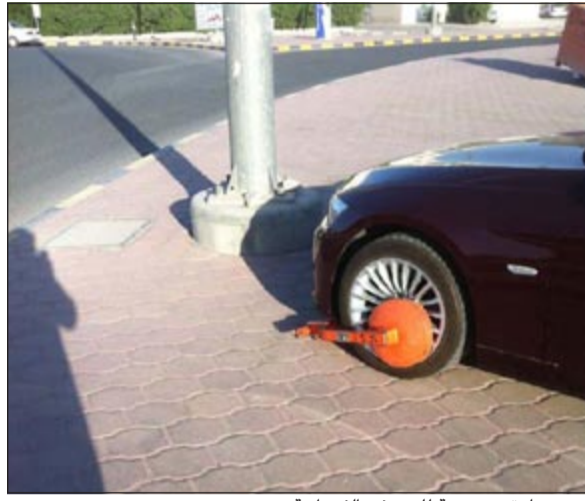
كبح سيارة معروضة للبيع في الفروانية