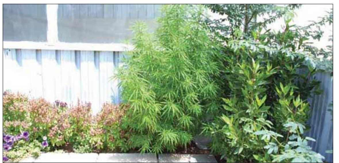
الماريجوانا احدث ضبوطية في منطقة كبد