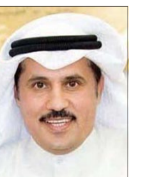
العديد صالح الغنم

الكويت وبقيّة أقطار دول التعاون. ومضى المصدر بالقول: انطلاقا من استهداف ماфия المخدرات لسدول الخليج العربي ودخول كميات بنسب كبيرة تفوق اعداد المتعاطين يصبح هناك فائض في هذه المواد المخدرة وهذا ما يدفع بإمكانية تهريبها من الكويت او دول خليجية الى بلدان اخرى. لافتا الى ان تهريب المواد المخدرة من دول خليجية يعد بالنسبة لتاجر المواد المخدرة أسهل من اقطار معروف عنها زراعة الحشيش وبقيّة المخدرات الأخرى. وأشار المصدر الامني الى ان وجود مخدرات في