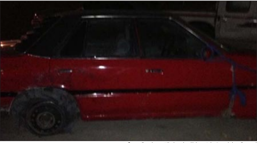
إحدى السيارات وقد انفجر اطرافها جراء الاستهتار والرعونة