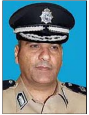
اللواء خالد الدين

وما ان اخطر اللواء ابراهيم الطراح وكيل نيابة الجھراء بالتقرير حتى امر بتسجيل قضية بحق النزيل المصري برقم 101/2013 جنائيات الصليبية بعنوان «الحريق العمد والشروع في الانتحار» وحسب مصدر امني فإن ادارة السجن المركزي رصدت دخانا يصدر من زنزانه بالعزل الانفرادي وتخص وافدا مصريا يدعى (ن.ح.ن) حيث تم فتح الزنزانه بسرعة