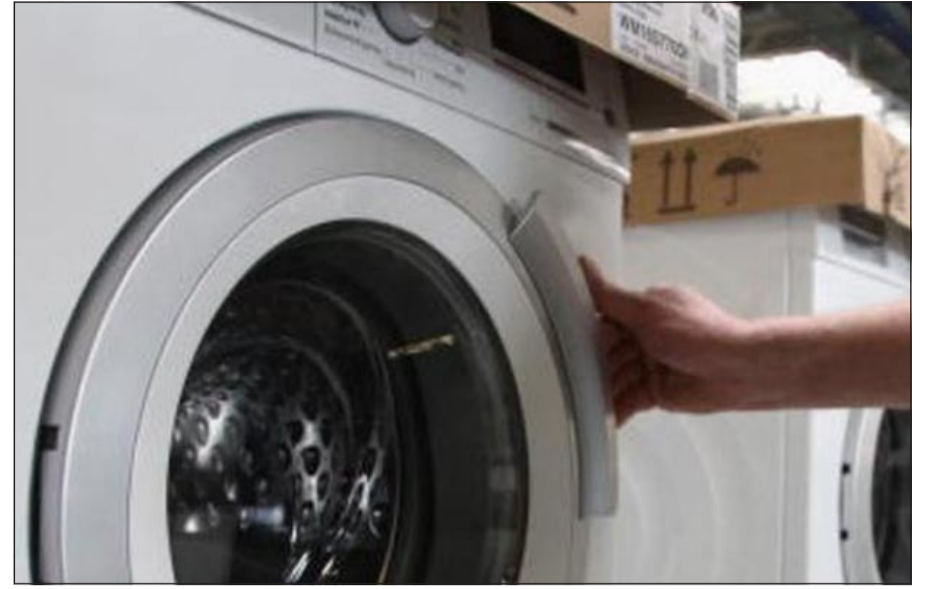
الغسالة كادت تضيق على الرجل الثروة

قالت مجموعة من الباحثين الاسكتلنديين بجامعة إيدنبرغ إن الأسماك لا تشعر بالألم عند اصطيادها إذ إن المنطقة المحيطة بفك السمكة عند مكان غرس الصنارة خالية من الأعصاب تماما. يأتي ذلك في الوقت الذي يحدث فيه النقاش من قبل نشطاء بحقوق الحيوان لتجريم رياضة الصيد واعتبارها جريمة قاسية لاعتقادهم بـ «تعذيب الأسماك». ووجدت الدراسة التي أجراها فريق يتكون من 7 علماء ونشرت في مجلة الثروة السمكية وعلوم البحار والصيد، أنه عند التقاط فم السمكة لمقدمة الخفاف وظهورها تتلوى يمينا ويسارا أمام الصيد فهي لا تشعر بالألم نهائيا لأنها لا تملك القوة اللازمة بالتحرك لذلك. وأشار الباحثون إلى أن رد فعل الأسماك عند تعلقها بالصنارة هو في الواقع مجرد رد فعل غير واع يشبه الانعقاد والتخدير، وليس استجابة للشعور بالألم، واستنتج العلماء ذلك بعد حقن مجموعة من سمك السلمون المرطق بمحلول حمضي سام في أعلى الشفاه ولم تظهر أي استجابة.