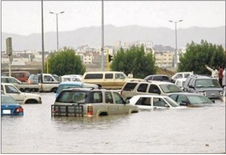
عشرات السيارات غارقة في المياه بالطائف