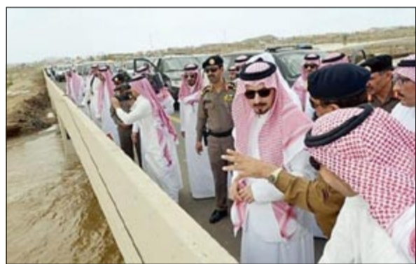
أمير منطقة عسير يتفقد موقع انهيار السد

العربية: أكد الأمير فيصل بن خالد بن عبدالعزيز أمير منطقة عسير أن من يتحمل مسؤولية انهيار سد تبالة هو الذي عهد بتنفيذ المشروع للمقاول الأقل سعرا وليس الأكفأ، داعيا لوضع الأمور في نصابها وتغيير نظرة ترسية المشاريع بحيث تكون للأكفأ وليس للأقل عرضا، نقلا عن صحيفة «عكاظ» السعودية أمس. وأشار إلى أن ما شاهده على أرض الواقع من عمل المقاول لا يعدو كونه مجموعة ردميات بسيطة لا ترتقي إلى اسم مشروع سد، وأن هذا المشروع كان يفترض أنه شارف على الانتهاء مقارنة بعمره الزمني المحدد بست سنوات.