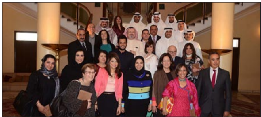
صورة جماعية للضيوف