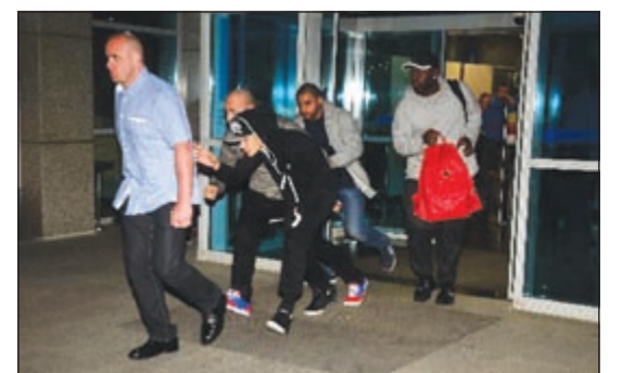
بيبر أثناء خروجه من المطار

أثار النجم، جاستين بيبر، الضجة من جديد، خلال جولته الموسيقية العالمية، هذه المرة في اسطنبول، حيث حاول أن يغادر أرض المطار