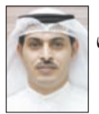
رسالة واشنطن زغار الرشيد

منظمتنا ليست مخلب قط سياسي للحكومة الأميركية وتعامل بكل شفافية مع هذا الأمر وعملنا معن وغير سري ولا نخفي شيئا