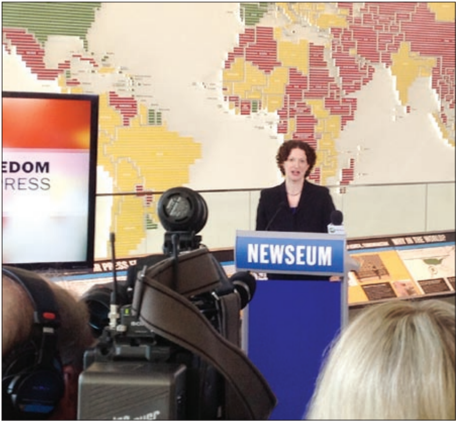
الناطقة باسم «فريدوم هاوس» تعلن نتائج تقرير الصحافة العالمية لعام 2013