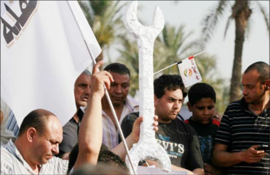
نشطاء نقابيون خلال مسيرة تطالب بحقوقهم بمناسبة عيد العمال في القاهرة

القاهرة - وكالات: تواترت أنباء عن استدعاء مؤسسة الرئاسة المصرية عصر أمس رئيس مجلس الوزراء د. هشام قنديل لإقرار الأسماء النهائية المرشحة لتولي حقائب وزارية في التعديل الوزاري المرتقب والذي من المقرر أن يتم الإعلان عنه خلال الساعات المقبلة. وسيجري تغيير 6 حقائب وزارية فقط، هي: العدل، والثقافة، والشؤون القانونية، والكهرباء، والسياحة، والآثار. وكشفت مصادر - بحسب ما نشره الموقع الإلكتروني لحزب الحرية والعدالة، الذراع السياسية لجماعة الإخوان المسلمين - عن بعض الأسماء المرشحة بشكل نهائي للتعديل الوزاري المرتقب، حيث أكدت أن المستشار عمر الشريف مساعد وزير العدل هو المرشح الأقوى لتولي وزارة الدولة للشؤون القانونية، كما أوضحت من جهة أخرى، أفاد مصدر