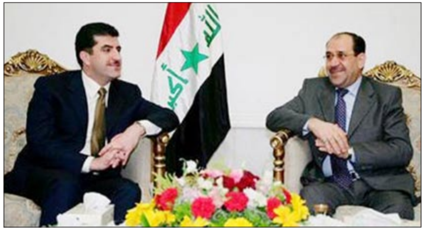
رئيس الوزراء العراقي نوري المالكي ورئيس حكومة إقليم كردستان نجيرفان بارزاني خلال لقائهما امس الاول

وأصاب اجتماعات أربيل والنخف الملكي بالجنون الشديد ومساءً يمكن أن تنفذ البلاد عبر اختبار مرشح شعبي معتدل يصحح المسار وأن مصورا متنوعاً فكرياً وطائفيًا وقومياً بين أربيل والنخف وسيجري الأمريكيين والبرانيين على تعديل سياستهم في العراق». وأردف «قاعدة المالكي هي اتروكوني أعمل بلا قواعد ولا ضوابط وإنه يريد أن نتكيف مع