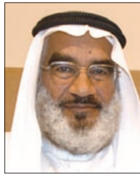
د. دعجيل التمشي

أوضح الطيباني أن هذا له فن وله أسلوب وله قواعد من التريبعة الفكرية والثقافية منها: