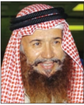
الداعية أحمد القطان