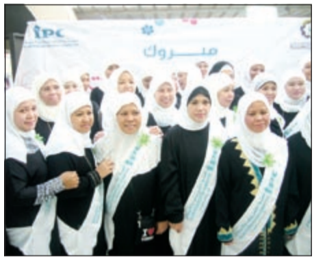
مجموعة من الخريجات

ضمن الأنشطة والدورات الخاصة بمشروع «علمي الإسلام» قامت لجنة التعريف بالإسلام بتخريج كوكبة جديدة من المسلمات الجدد في مختلف أفرعها النسائية المنتشرة بالكويت، وقد تم تكريم 150 مهتدية في المنقف، وفي فرع السالمة تم تكريم 56 مهتدية، واستمرت الدورة 3 شهور. وقد تم تخريج 1613 مهتدية في «علمي الإسلام».