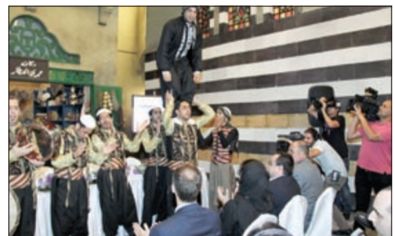
من أجواء المؤتمر الصحفي