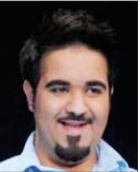
عيد العزیز الويس

«ناسف لعدم الإزعاج» من إعداد وتقديم مي العيدان ويبدأ كل جمعة عبر قناة سكوب الساعة 11 ليلا لمدة ساعتين على الهواء.