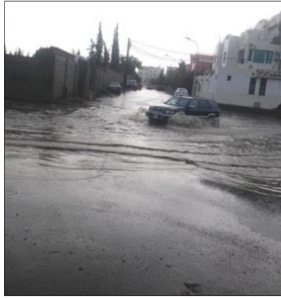
الأمطار أغرقت عسير