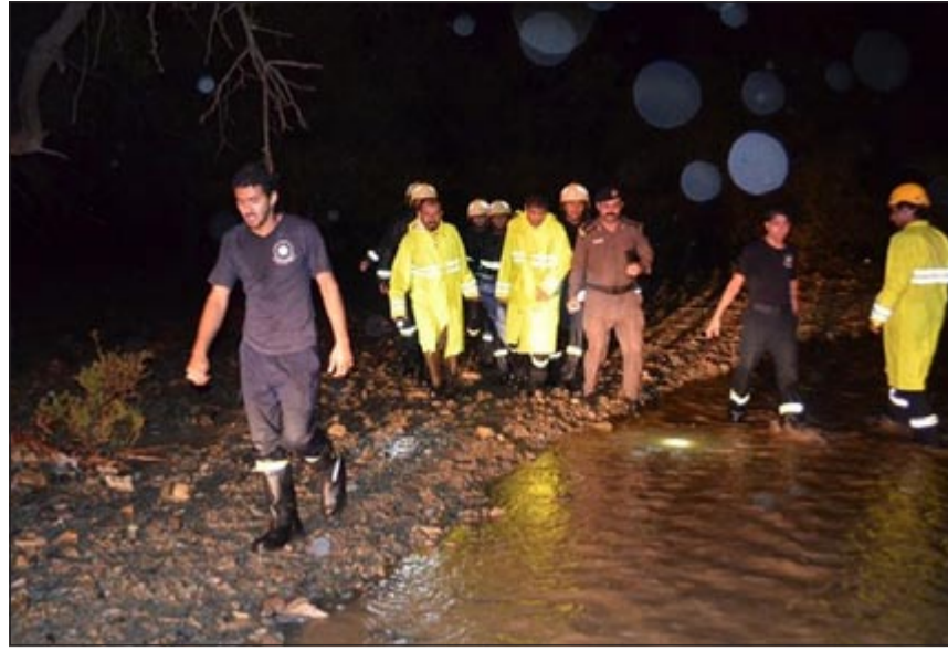
الدفاع المدني ورجال الإنقاذ يحملون جثة أحد الضحايا