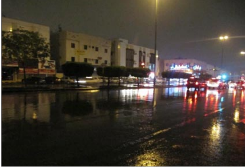
الرياض العاصمة بعد أن أغرقتها الأمطار

أن الطفل لم نعثر عليه في حينها، ولذا ضاعفنا الجهد وعدد الفرق حتى انتشلناه في النهاية». وأضاف: «لا تزال جهودنا في البحث مستمرة، حيث وردنا بلاغ بفقدان 3 أشخاص من جنسية عربية تابعين لشركة تعمل في تنفيذ الطريق الموصل من محافظة العقيق إلى محافظة القرى»، وأكد أن الأجهزة المعنية لا تزال في حالة استنفار كامل لمتابعة الأوضاع. ويقوم أمير منطقة الباحة، مشاري بن سعود، بجولات ميدانية تفقدية في المناطق المتضررة، فضلاً عن زيارة مماتلة لمركز القيادة والسيطرة للاطمئنان ومتابعة الأحوال والبلاغات عن المفقودين.