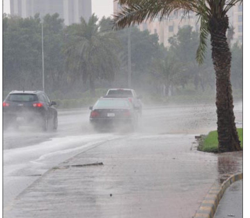
أمطار متفرقة على البلاد أمس

الحلال في البر من تقلبات الجو. وقال رمضان: تنبيه جوي فرصة لأمطار رعدية وينبه بأخذ الحيلة خاصة الاخوة الحداقة وأصحاب الحلال في المناطق البرية، والله أعلم.