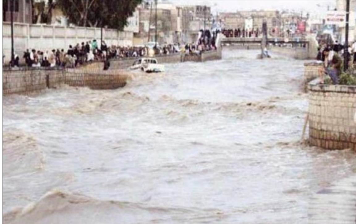
شوارع اليمن تحولت إلى برك مياه

شمال اليمن في انهيار 50 منزلاً بينهم 30 في مدينة صنعاء القديمة وجرقت نحو 20 منزلاً في وادي آل أبو جبارة.