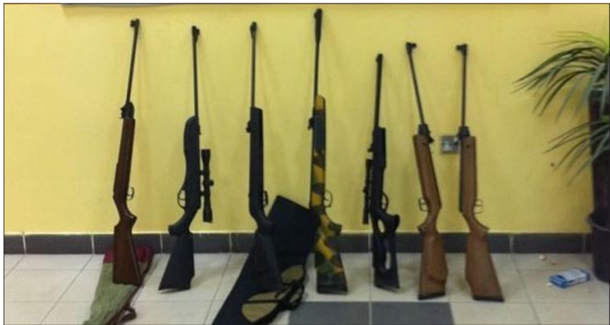
حصيلة حملة الأحمدى من الأسلحة