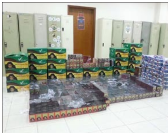
كمية الحناء بلغت 11400 علبة وعدد علب العصائر تجاوزت الـ 10000 علبة