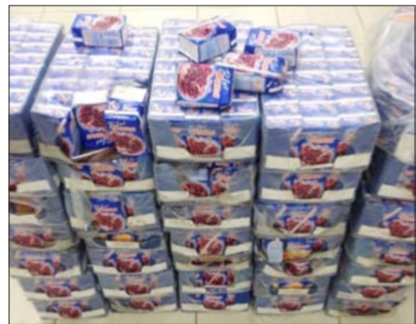
العصائر بعد ضبطها في ميناء الدوحة

وقال مدير الجمارك الشمالية وعصيرا، كما تبين ان البضاعة اشتبهوا في حمولة لنش قادم من ايران وتبين احتواؤه على 19 كرتونا تحتوي على 11400 علبة