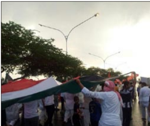
مجموعة من البدون خلال تجمهرهم امس

تجمهر عشرات من البدون يوم أمس رافعين أعلام الكويت ونظموا مسيرة في شارع النجاشي استمرت لدقائق وبعد ذلك تم الطلب منهم فض المسيرة وتجاوبوا مع الطلب دون ان تتدخل قوة الأمن لفض مسيرتهم بالقوة، هذا وحمل البدون أعلام الكويت وطلبوا بإعادة النظر في أوضاعهم.