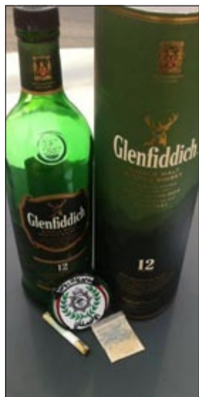
خمور مستوردة ضبطت مع مواطن