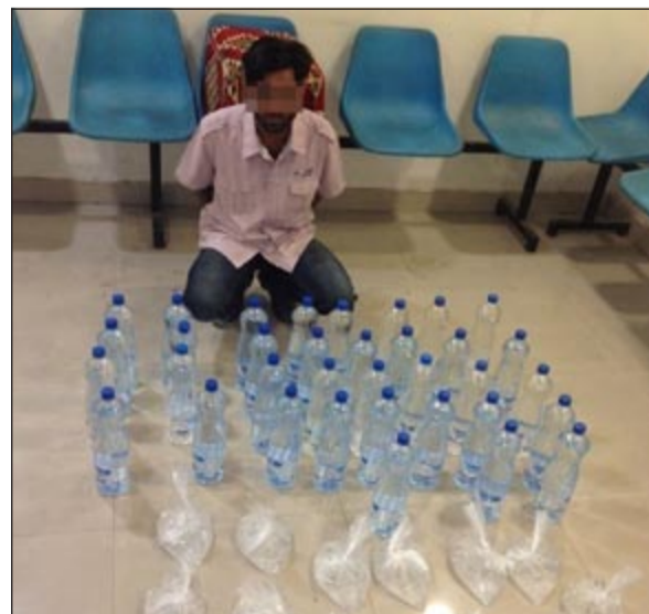
الأسبوي وأمامه الخمور المخبوطة