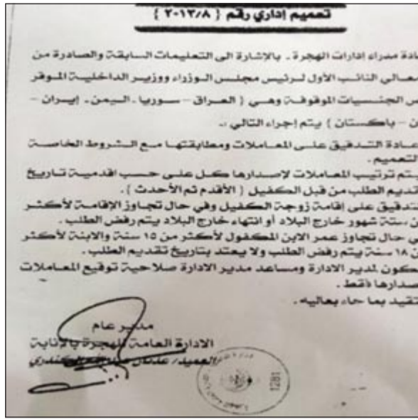
صورة زكروغرافية عن التعميم

في تعميم وصف بأنه انفراجة في مسألة حصول الجنسيات المحظورة من الدخول الى البلاد بسمعة التحاق بعائل وانتهت المركزية في استصدار سمات الحصول على سمات دخول والتي كانت محصورة في وكيل وزارة الداخلية المساعد لشؤون الجنسية والجوازات ومكتب النائب الأول لرئيس مجلس الوزراء ووزير الداخلية، حيث تضمن التعميم الذي حصلت عليه «الانباء» على نسخة منه السماح لمدراء الإدارات بالبت في طلبات الالتحاق بعائل حسب اقدمية تقديم الطلبات، وجاء في التعميم بناء على تعليمات النائب الأول لرئيس مجلس الوزراء ووزير الداخلية بشأن