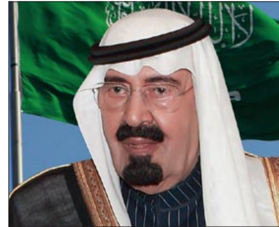
خادم الحرمين الشريفين الملك عبد الله بن عبد العزيز

في إلقاء الخطابات السياسية، واحتل وزير الداخلية الأمير محمد بن نايف مكانته في التصنيف عبر تميزه في مجال حفظ الأمن في البلاد، وقيادته وإدارته لأمر البلاد الأمنية. كما جاء رئيس الاستخبارات العامة الأمير بندر بن سلطان ضمن القائمة نتيجة لدقة تعامله مع العديد من الملفات الشائكة، أما في مجال التميز الاقتصادي فدخل القائمة كل من وزير المالية إبراهيم