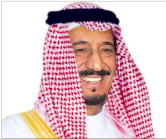
صاحب السمو الملكي الأمير سلمان بن عبد العزيز ولي العهد نائب رئيس الوزراء