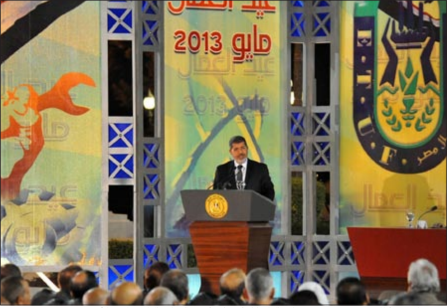
صورة ارشيفية للرئيس محمد مرسي خلال لقائه كلمة بمناسبة عيد العمال بالقاهرة امس الاول

القاهرة - وكالات: نفت وزارة الداخلية المصرية صحة ما تناقلته بعض وسائل الإعلام وعدد من المواقع الالكترونية من استدعاء جهاز الامن الوطني لبعض الرموز الدينية وتهديدهم بالقتل.