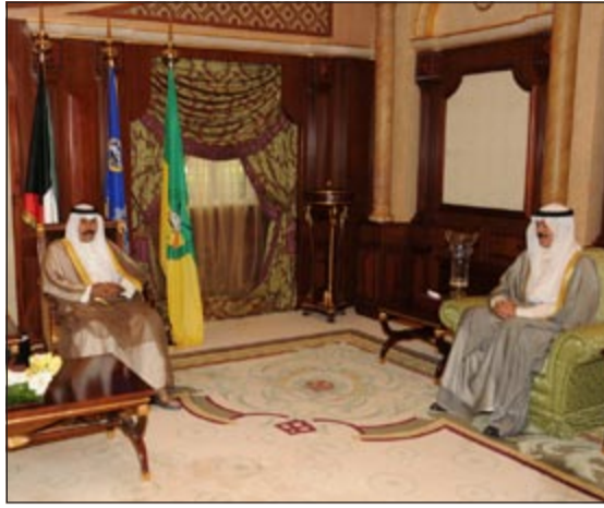
سمو ولي العهد الشيخ نواف الأحمد مستقبلاً الشيخ محمد الخالد