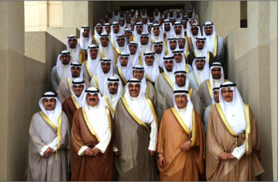
الشيخ صباح الخالد وخالد الجارالله وعبد العزيز الشارخ مع المحققين الدبلوماسيين بعد مراسم أداء قسم اليمين