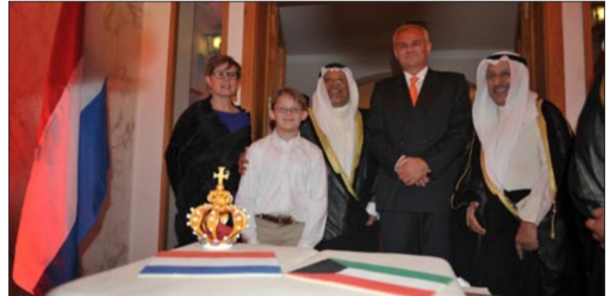
الشيخ علي الجراح والسفير خالد المغامس والسفير الهولندي نيكولاس بيتس