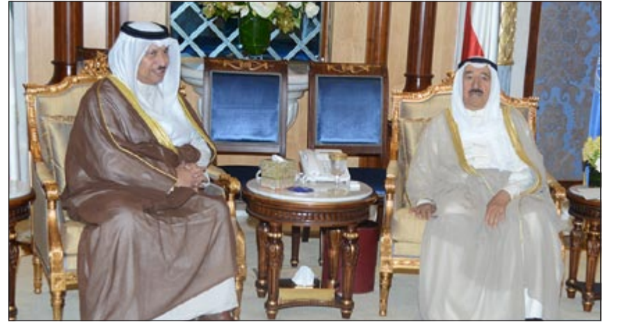
صاحب السمو الأمير الشيخ صباح الأحمد مستقبلاً سمو الشيخ جابر المبارك