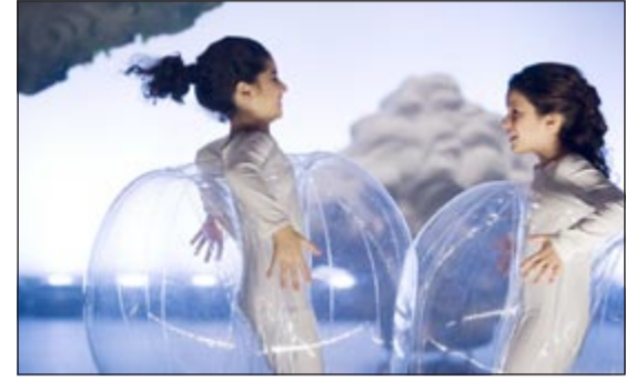
تأفورة الشارقة الموسيقية تعرض دعابة «قطورة» يومياً للجمهور

القدر الكافي لتحقيق التنمية المجتمعية، وهو ما جعلها تهتم بالقضايا الرئيسية التي تعزز من قدرات النمو الفكري للأطفال. وبيّنت المجموعة أن الحفل الذي شهده الحضور المميز للشيخة بدور بنت سلطان القاسمي الرئيس الفكري للمجلس الإماراتي لكتب اليافعين لتكريم رواد أب وثقافة الأطفال والشيخ سلطان بن أحمد القاسمي رئيس مركز الشارقة الإعلامي قد كرمها على دعابيتها الناجحة «قطورة» وهي الدعابة التي اتخذت شعار «حفاظ على الماء حفاظاً على الحياة».