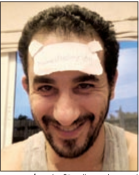
أحمد حلمي والورقة على رأسه

أحد متابعيه نشر صورة لإينته لي لسي، رفض حلمي واكتفى بنشر صورة شخصية له. وكتب حلمي حسابه الشخصي على ورقة ولصقها على رأسه، والتقط صورة كوميدية لنفسه ثم نشرها، ليؤكد للجميع صحة الحساب الذي يحدتهم منه، وذلك بعد 3 ساعات متواصلة من الأسئلة التي ألقاها محبيه عليه ليتأكدوا من شخصيته.