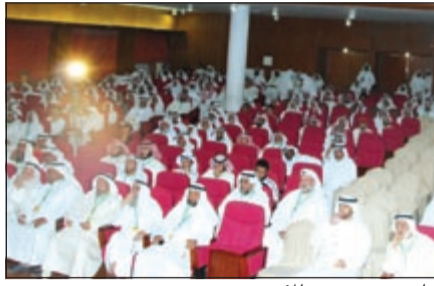
جانب من حضور المؤتمر