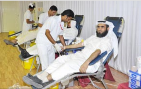
عدد من موظفي الهيئة يتبرعون بدمائهم

وقال نائب مدير عام الهيئة إيد الشارخ في تصريح صحفي ان موظفي الهيئة تجاوبوا مع دعوة ادارة الاعلام والعلاقات العامة بالهيئة للتبرع بالدم، ونوافدوا على الخيمة المجهزة التي خصصت لهذا الغرض بروح عالية وحرص شديد على المشاركة في هذا العمل الإنساني النبيل، وإيمانها منهم بأهمية مثل هذا العمل في خدمة المرضى والمحتاجين، معربا عن شكره وتقديره لموظفي الهيئة. وأشاد الشارخ بالتعاون الذي أبداه بنك الدم، وبالجهد المتميز الذي بذله الطاقم الطبي للبنك بكل دقة وتنظيم، وحرص على توفير كافة الأجهزة والمعدات اللازمة، وتعبئة