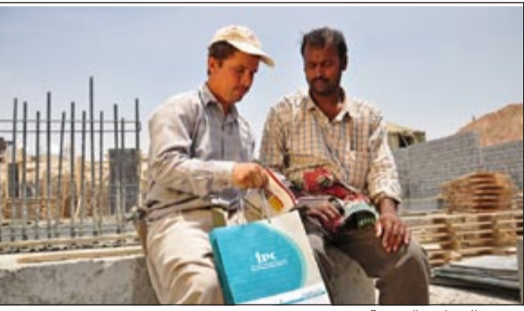
توزيع الحقائب الدعوية