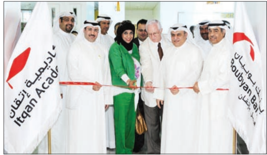
مسؤولو البنك والجامعة أثناء قص الشريط