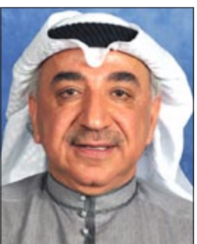
د.عبد الحميد دشتي

اعتبر النائب عبد الحميد دشتي مطالبة الغالبية المطلقة برئيس وزراء شعبي وحكومة منتخبة ظاهرة مستمدة من الربيع العربي، مشدداً على عدم قبول أفكار الغالبية لأن ظاهرها الرحمة وباطنها العذاب. وقال دشتي في تصريح للصحافيين إن النواب الحاليين من حقهم ممارسة دورهم الرقابي ولكن من غير الافتئات على أجهزة الدولة، مطالبا وزير الكهرباء بالضغط على إجراءاته إن كانت سلبية حتى لا تتعرض المنظومة الكهربائية للخطر في 2014. من جانب آخر ثنن النائب د.عبد الحميد عباس دشتي لنائب رئيس الوزراء ووزير