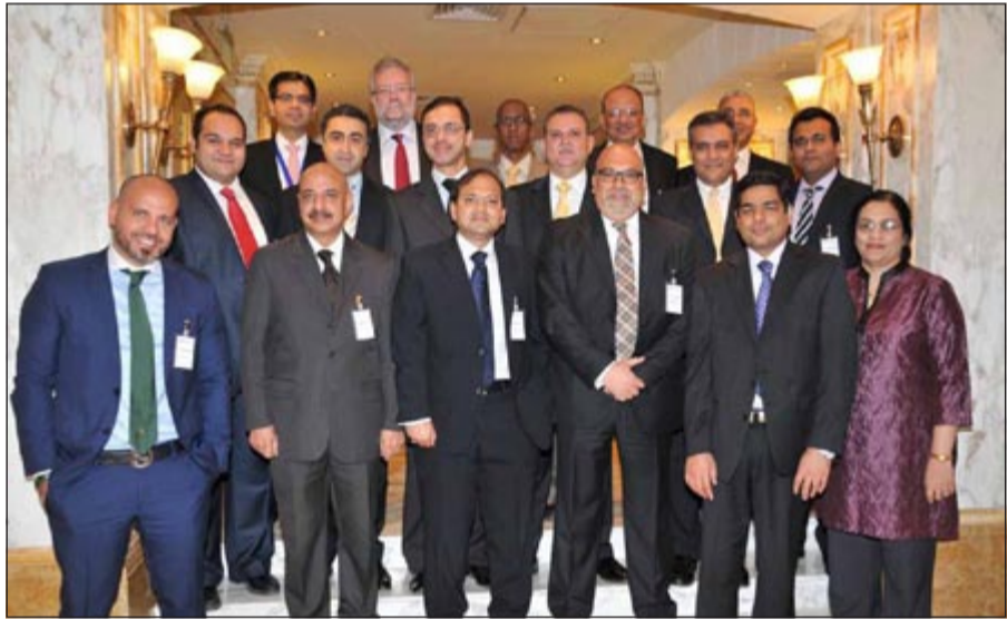
جانب من مؤتمر التدقيق الداخلي الأول الذي نظمه بنك برقان