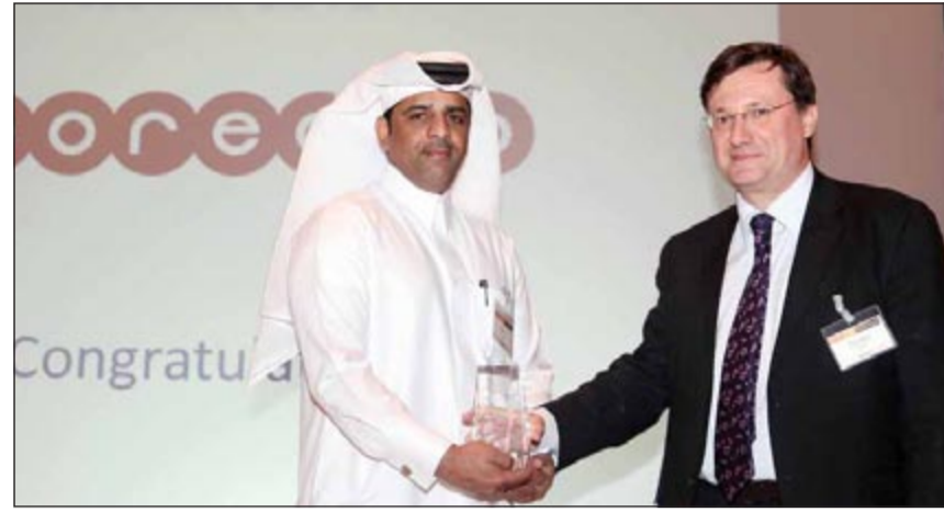
جانب من تسلم الجوائز

فازت Ooredoo بجائزتين خلال حفل جوائز «تي إم تي فايننس - الشرق الأوسط وشمال أفريقيا 2013»، الحفل الذي حضره عدد من قادة الأعمال وكبار التنفيذيين في عالم الاتصالات بالمنطقة. حيث فازت Ooredoo بجائزة «أفضل مشغل للاتصالات الجوال»، كما فازت «أسياسيل»، شركة الاتصالات الرائدة في العراق التابعة لمجموعة Ooredoo، بجائزة «صفقة العام في أسواق المال - الأسهم» بعد النجاح الواسع الذي حققه طرح أسهمها للاكتتاب العام في شهر فبراير 2013.