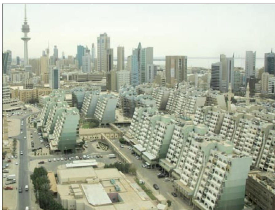
انخفاض التداول على العقارات الخاصة وارتفاع العقارات الاستثمارية والتجارية

بواقع 4 عقارات واستقر المؤشر بواقع صفر عقار بالنسبة لعقارات المخازن والشريط الساحلي والعقار الحرفي خلال هذه الفترة. الوكالات العقارية أما عن مؤشر تداول الوكالات العقارية، فإن إجمالي المقارنات المتداولة خلال الفترة نفسها بلغ 12 عقاراً مقارنة بالأسبوع السابق، حيث بلغ إجمالي المقارنات المتداولة 9 عقارات وذلك بارتفاع مؤشر تداول الوكالات العقارية بواقع 3 عقارات.