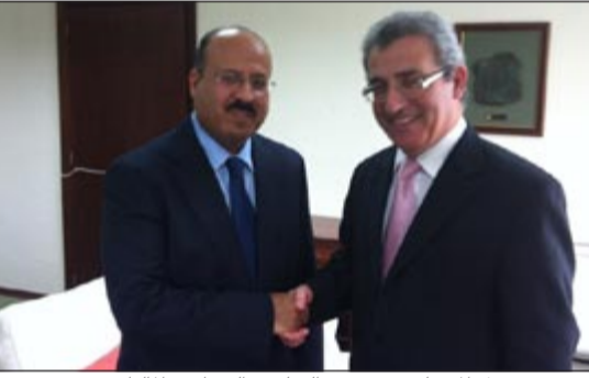
السفير فيصل المسليم مع وزير التعليم والتوظيف المالطي

وطلب الإنسان لما يتمتعون به من سمعة طبية واجتهاد. معرباً عن تطلعه إلى التحاق مزيد من الطلبة الكويتيين العام الجامعي المقبل وفي تخصصات مختلفة، وتكثيف تبادل الخبرات والمعلومات وزيارات الوفود بين البلدين ضمن التعاون المتشعب في مجال التربية والتعليم. ونقل المسليم بمناسبة لقائه الأول بوزير التعليم في الحكومة المالطية الجديدة تهناني وزير التربية والتعليم العالي د.نايف الجرف له بمنصبه الوزاري.