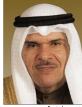
الشيخ سلمان الحمود

«فن الكاريكاتير» الذي يقام ضمن فعاليات الملتقى لهذا العام ويعرض من خلاله مجموعة من أبرز اللوحات الفنية لعدد من الرسامين العرب، وسيفتتح المعرض في تمام الساعة السادسة من مساء اليوم بقاعة الفنون الجميلة في ضاحية عبدالله السالم. وتستمر أعمال الملتقى الكويت الإعلامي للشباب لليوم الثاني غداً، وتبدأ الأعمال بالجلسة السابعة التي تقام تحت عنوان «أهمية خفيفة تعرض من خلالها عدد من التجارب الإعلامية والسير الذاتية لعدد من الوجوه الإعلامية العربية الشابة وكيف استطاعت أن تحقق ذاتها. هذا وسيتم افتتاح معرض