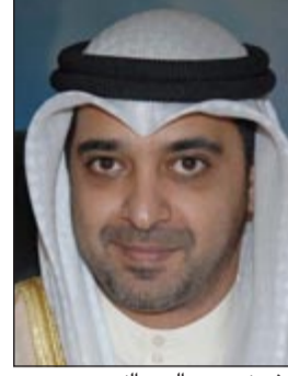
الشيخ محمد العبد الله