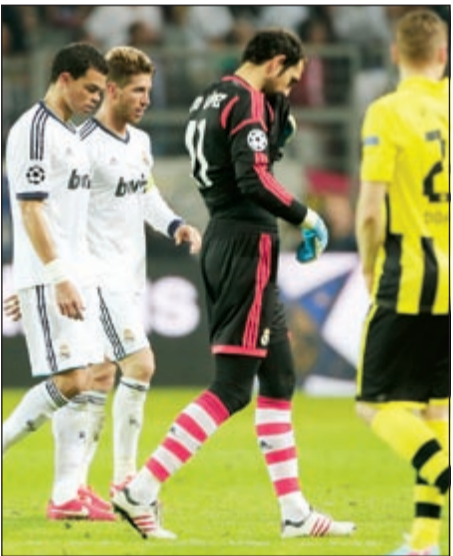
حزن وحسرة وخيبة على لاعبي الريال