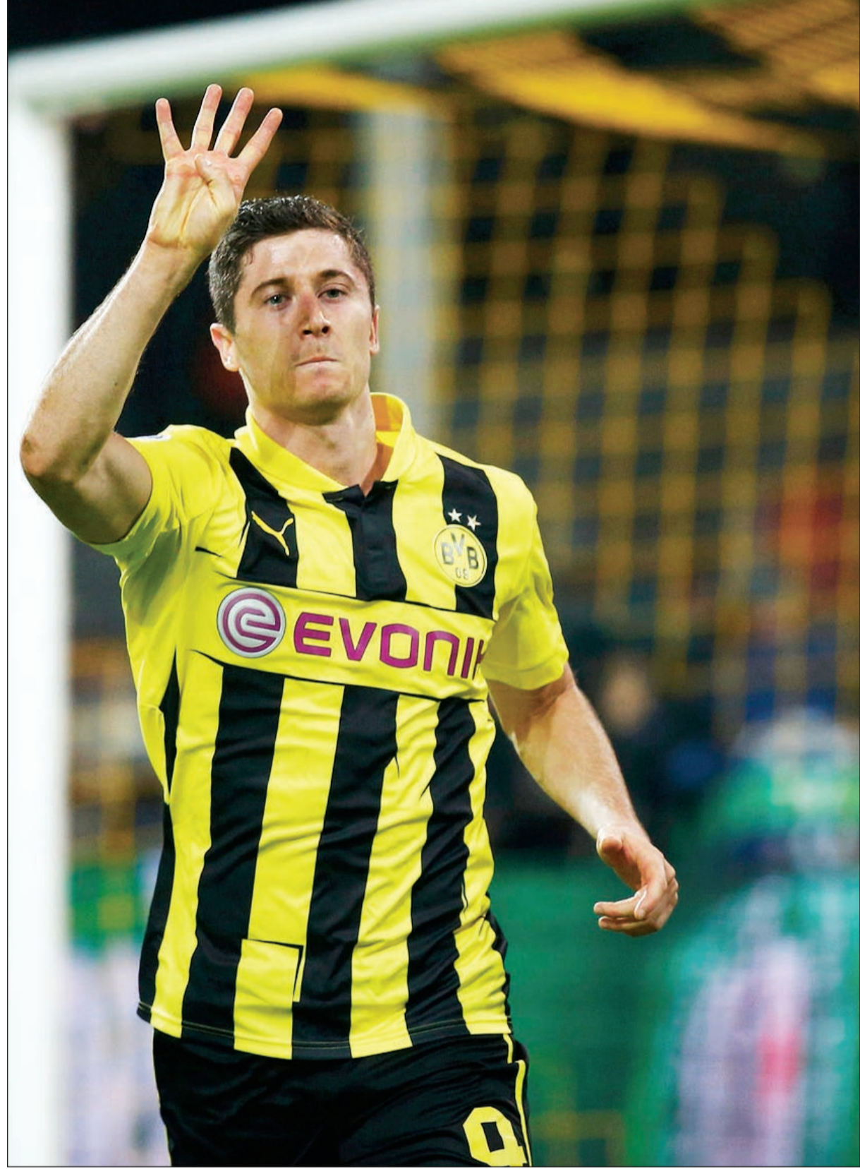
نجم دورتموند البولندي ليقاندوفسكي يشير إلى 4 عدد أهدافه

والحالية بعد أسطوري ريال مدريد الفريدو دي ستيفانو والمجري فيرينيك بوشكاش ولاعب برشلونة السابق المجري الآخر ساندر كوسيتش واللاعب الحالي الأرجنتيني ليونيل ميسي.