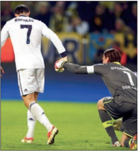
نجم الريال رونالدو يساعد حارس دورتموند فيله