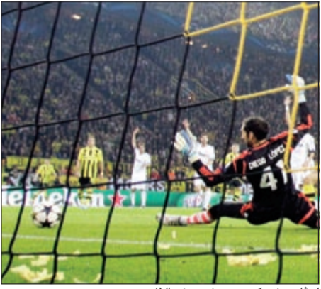
ليقاندوفسكي يسجل هدفه الثاني