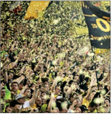
جماعير دورتموند «فزعت» مدربها وفريقها باجمل صورة