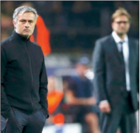
كلوب وضع مورينيو وراهه بالتكتيك