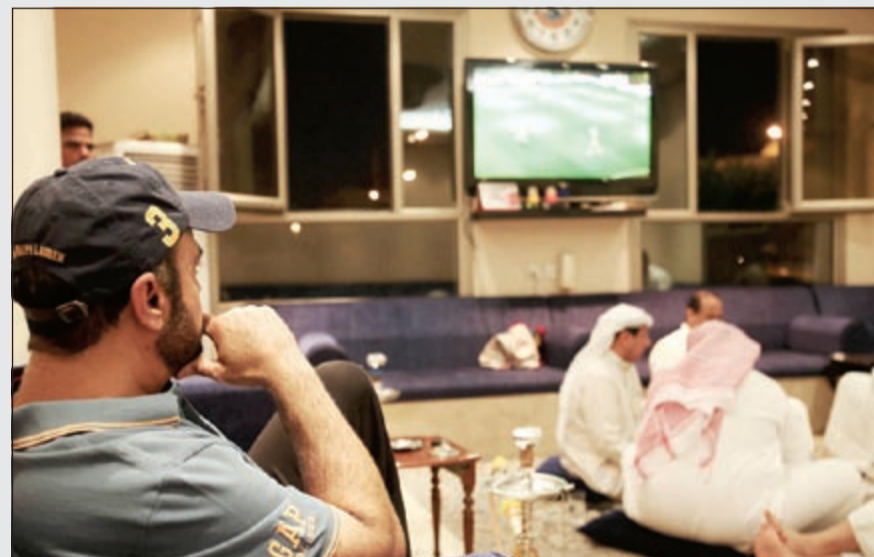
متابعو ديوانية الذائر خلال مباراة الريال ودورتموند (عادل يعقوب)