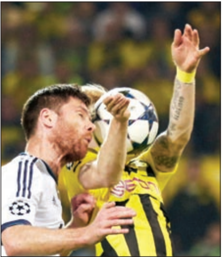
تشابي الونسو يرتكب خطأ جاءته منه ركلة جزاء