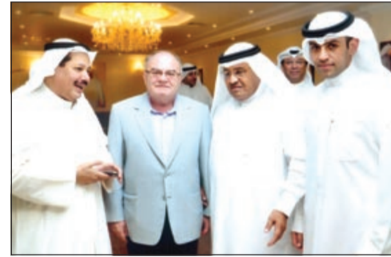
السفير اللبناني خضر حلوي وأنور الجودر في حديث مع عبدالله المقلد