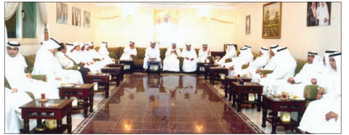
جمع من الحضور في ديوان المقلد

تشرف معرض SIHH «صالون إنترناسيونال دولا هوت اورلوجيري» للساعات الراقية بحضور الممثلة والمخرجة كارمن شابلن لتقديم فيلمها القصير «لكل شيء وقته»، الذي يعرب عن احترامه وتقديره للوقت والتراث ويميط اللثام عن ساعة جدتها شارلي شابلن ميموفوكس Memovox من جيجير لوكولتر. تتشارك كارمن شابلن وجيجير لوكولتر قصة تستحق أن تروى، فقد قرر كلاهما أن يقدم مشروعاً فنياً قد تم الكشف عنه في الليلة الماضية وذلك احتفالاً بمناسبة الذكرى المائة والثمانين لتأسيس جيجير لوكولتر. عندما استقر شارلي شابلن في سويسرا، أرادت الحكومة السويسرية أن تقدم هدية ترحيب للرجل العظيم الذي شكلت موهبته علامة فارقة في التاريخ. وكانت الهدية التي تلقاها شارلز سبغسر شابلن هي ساعة جيجير لوكولتر التي يظهر على غطائها الخلفي نقشاً محفوراً لعبارة «تقديرنا من حكومة مقاطعة فود، إلى شارلي شابلن 6 أكتوبر 1953»، وقد عرضت هذه الساعة التاريخية في معرض SIHH. لقد قرر مصنع الساعات الشهير الذي يقم شراكة واسعة النطاق مع مختلف الأحداث السنوية الهامة في العالم «مهرجان البندقية