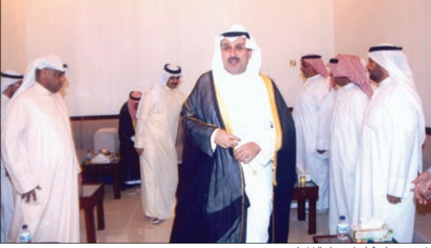
الشيخ حمد جابر العلي في ديوان الخشمان