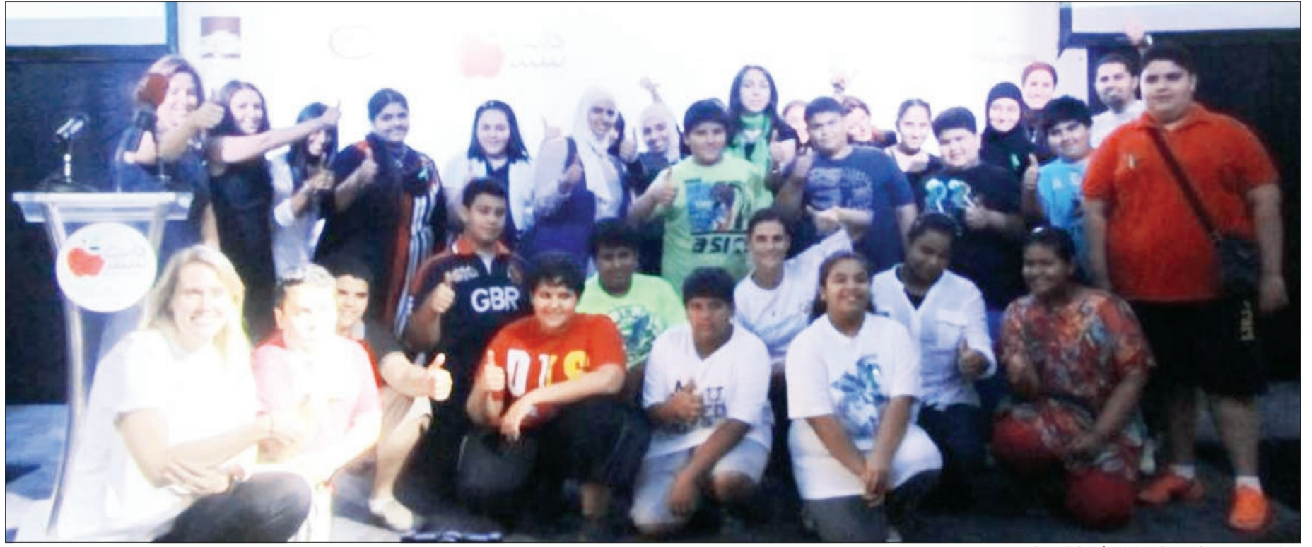
مشاركون في حملة لتوعية الأطفال بأهمية الغذاء الصحي

وأخيراً Ipanema متوافره في معارض مركز النصر الرياضي ضمن فروعه المنتشرة في الكويت، بالإضافة إلى الدول العربية التي تشمل المملكة العربية السعودية ومملكة البحرين والعراق وجمهورية مصر العربية وقريبا في دول أخرى على مثال باكستان.