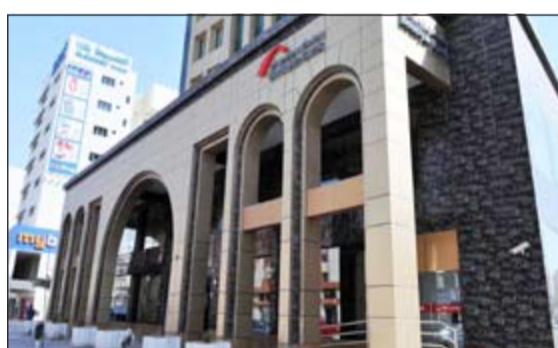
الفرع الجديد في حولي

إن الفرع الجديد يعتبر بمنزلة فرعين في فرع واحد حيث يضم قسمًا لخدمة الرجال والثاني لخدمة السيدات حرصاً من البنك على تقديم خدماته للسيدات في أجواء تمنحهن المزيد من الخصوصية والراحة. وبناء على جميع المزايا السابقة التي يتميز بها الفرع الجديد فسيتم نقل جميع حسابات العملاء الموجودة في فرع حولي القديم (شارع بيروت) إلى هذا