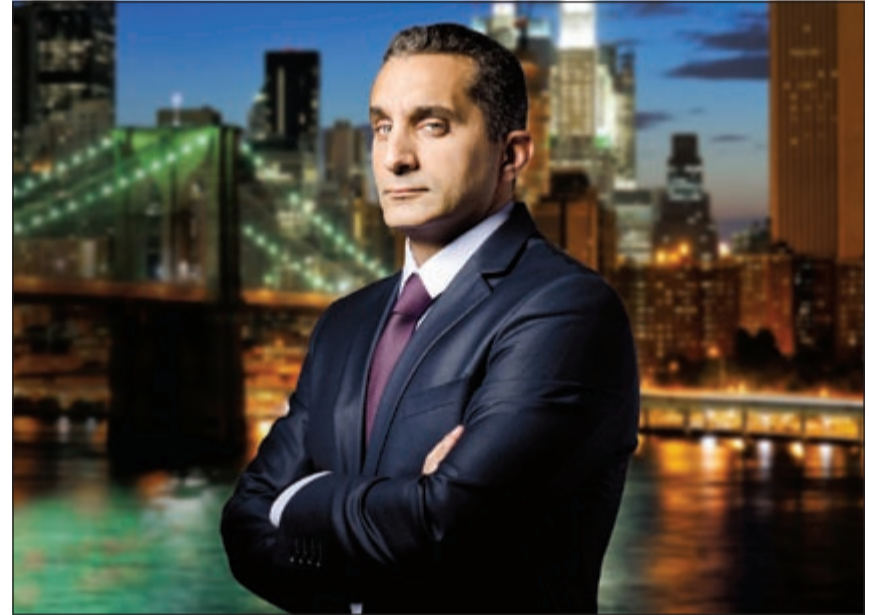
الإعلامي باسم يوسف

وفي لقاء سابق جمع بين النجمين العام الماضي ولاقي انتشاراً واسعاً حينها، ناقش الاثنان واقع الحياة في مصر والصورة المغلوطة التي تظهر فيها على وسائل الإعلام الوطنية. ويرتقب الجمهور عرض اللقاء الاستثنائي الجديد حصرياً على قناة «OSN Comedy HD» غدا الخميس الساعة 9 مساءً بتوقيت السعودية.