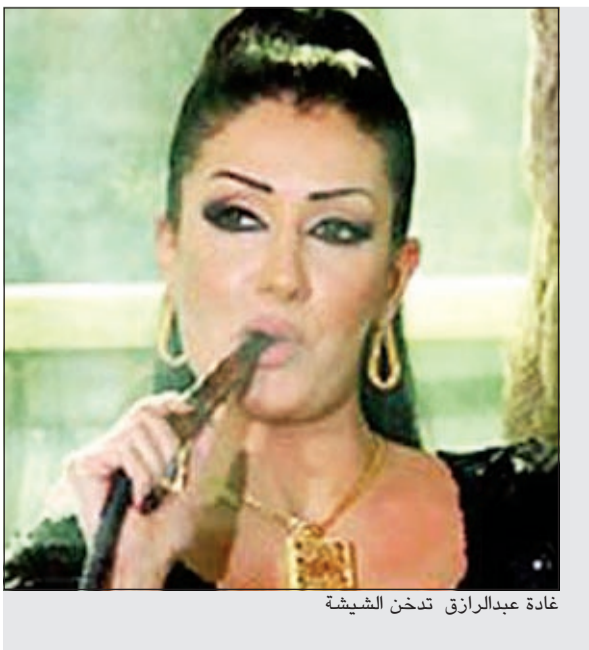
غادة عبدالرازق تدخن الشيشة

أزمة جديدة تشهدها كواليس فيلم «تتح»، إذ رفض محمد سعد الغناء مع مروى اللبنانية التي تشاركه البطولة مع دوللي شاهين. وتعود تفاصيل الأزمة عندما رفض النجم الكوميدي الغناء مع مروى، مفضلا تقديم الأغنية الدعائية للفيلم مع دوللي شاهين، وقام بتسجيل أغنية «السلك لمس» مع المطربة