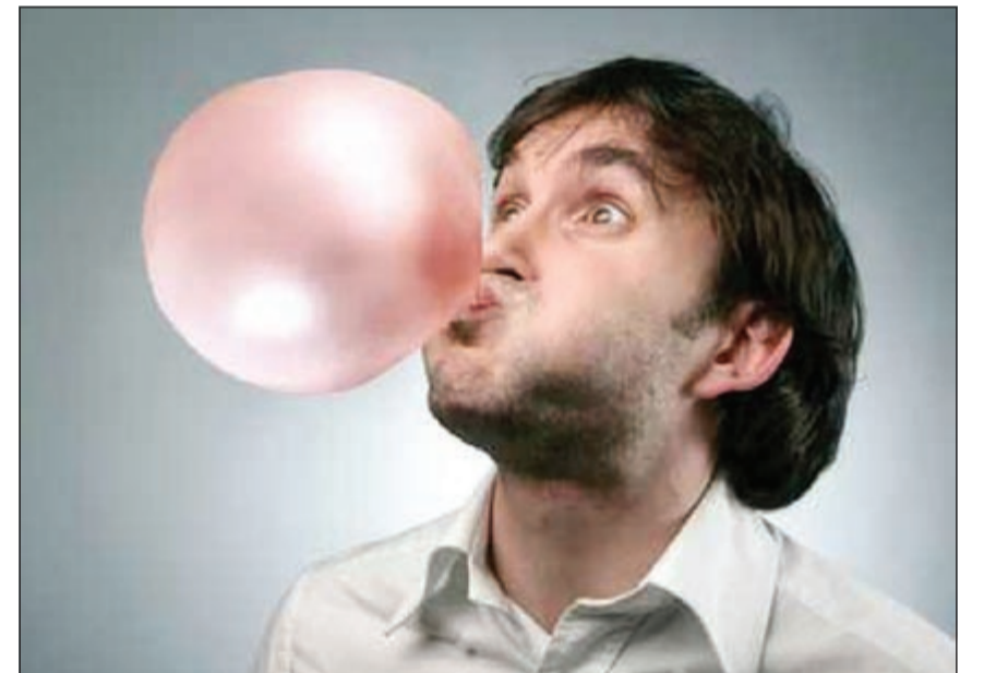
يساعد مضغ العلك على فتح قناة استاكيوس