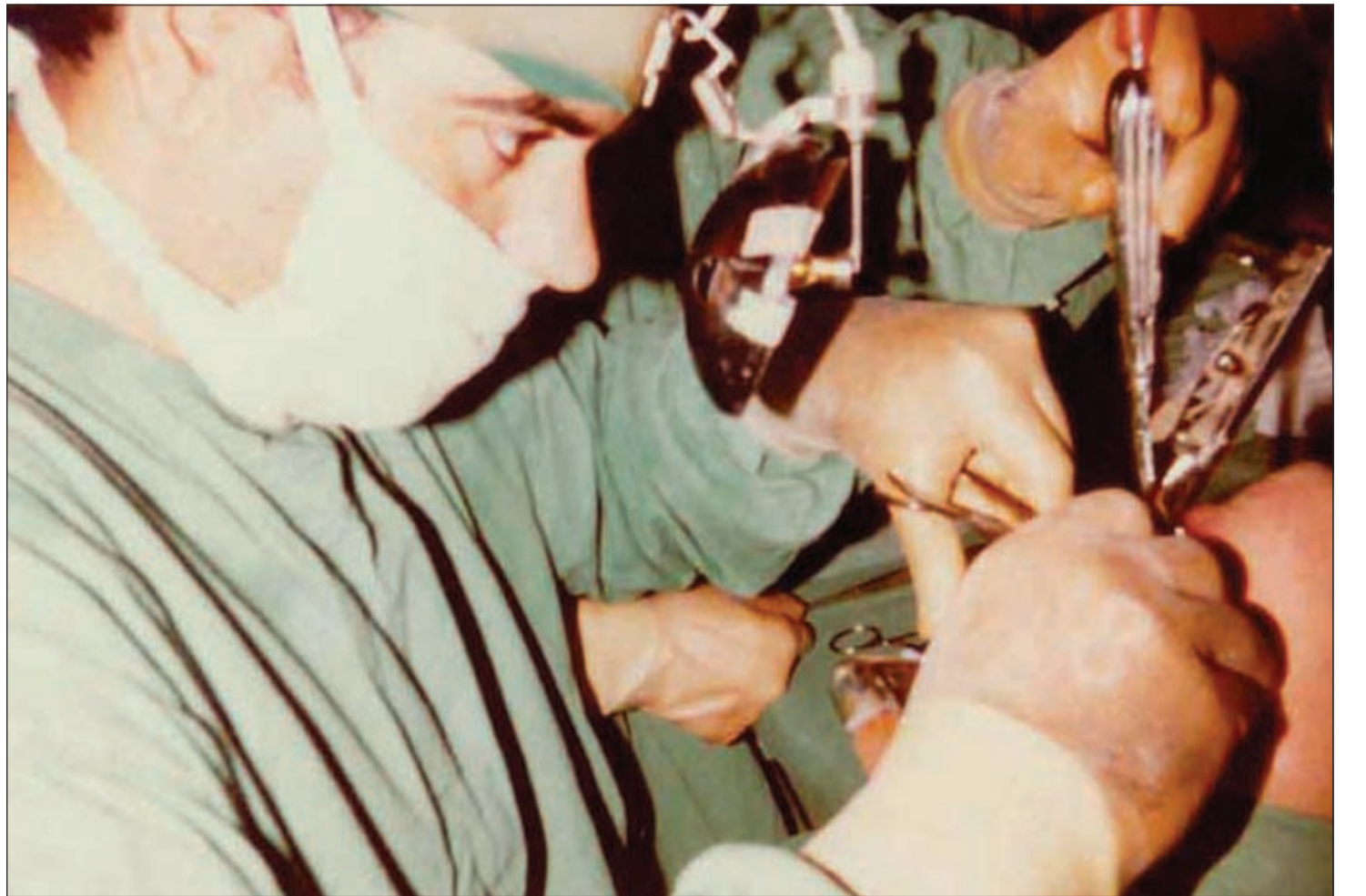
اللحميات الموجودة بالأنف تعالج جراحياً

والشفاء منه يمكن جدا في حالات الالتهاب الناتجة عن التهاب الفيروسي وهنا يجب أن يأخذ المريض نوعاً من الأدوية كالكورتيزونات وموسعات الشرايين والأوردة وفيتامين B، وبعض الأسبرين مع بعض جلسات العلاج الطبيعي ونسبة الشفاء الكامل في هذه الحالة تتعدى 90% أما الحالات الأخرى التي تكون نتيجة الإصابات والكسور في الجمجمة فنجري لها عمليات جراحية لإزالة التجمع الدموي الذي أصاب العصب وتكون أيضاً نسبة الشفاء فوق 90% في حالات أخرى تكون أقل حتماً من ذلك فتضطر إلى إجراء جراحات لترقيع العصب في المنطقة التي حدث بها القطع.