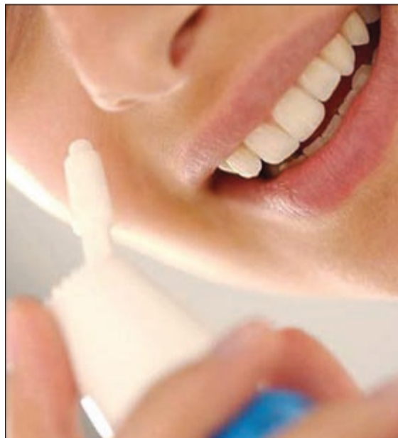
تساعد البخاخات على فتح قناة استاكيوس