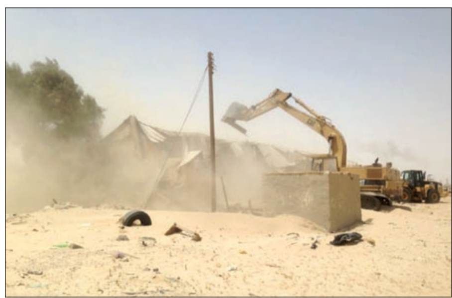
اليات البلدية تزيل أحد المباني القديمة بالقرب من سكراب أمفرة