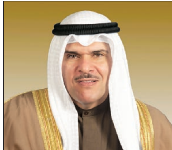
وزير الإعلام ووزير الدولة لشؤون الشباب الشيخ سلمان الحمود

بالشباب بهدف تنفيذ سياسات واهداف واختصاصات وزارة الشباب. من جانبها قالت عضو اللجنة الاستشارية العليا الشبيخة زين الصباح أن الفريق الاعلامي باللجنة اهتم بتطوير المجالس الفكرية والمعنوية للشباب، والذي يقوم على استراتيجية متكاملة تسلط الضوء على رؤية الوزارة واهتماماتها المستقبلية، واهمها التعاون الشبابي المشترك، موضحة ان