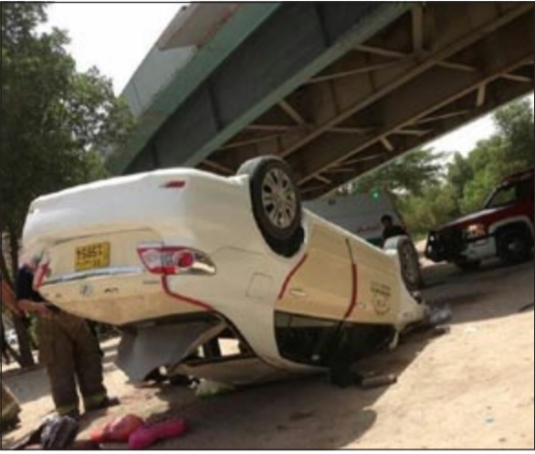
السيارة التي انقلبت من اعلى الجسر في خيطان