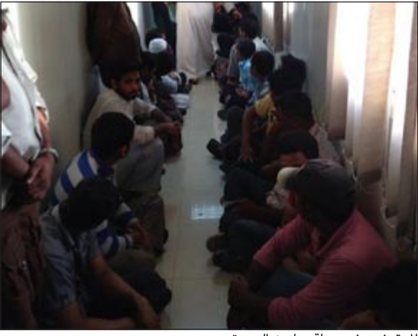
الموقوفون في حملة مباحث الهجرة