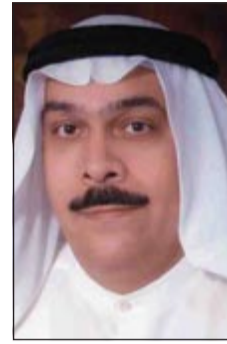
المستشار نصر سالم

منطقة السالمية شاهد سيارة بداخلها المتهم الأول «بدون» وآخر «إيراني» تصعد الرصيف وتتجاوز الإشارة الحمراء، وبعد استيقافها طلب من قائد السيارة أوراقه الثبوتية فقام بتهدده. وبعد إنزال المتهمين من السيارة استطاع المتهمان بتكتم تهم ثالث من الهرب بعد أن أيدوا مقاومة. وبتفتيش المتهم الأول (الإيراني) عثر على ستة أقراص يشتبه بأنها من المؤثرات العقلية، وبتفتيش السيارة عثر على ورق لف «رشيد»