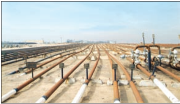
شبكة خطوط النفط لـ المصفاة الجديدة، ستكون بطول 350 كيلومترا

وأوضح المصدر أن خط الأنابيب سوف يبدأ من الخزانات من المنطقة الشمالية والجنوبية وستكون من 3 أو 4 خطوط للتغذية وصولاً إلى موقع المصفاة، مبيناً أن تصميم خط الأنابيب سيعتمد على نوعيات النفوط الثقيل التي ستتعامل معها المصفاة الجديدة.