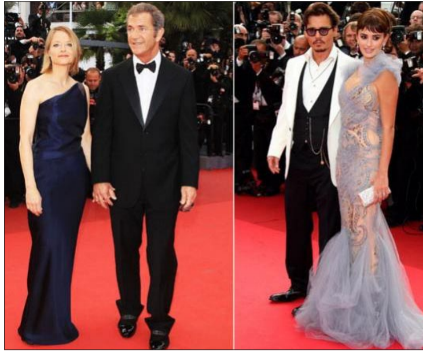
«كان»... يستقطب نجوم العالم