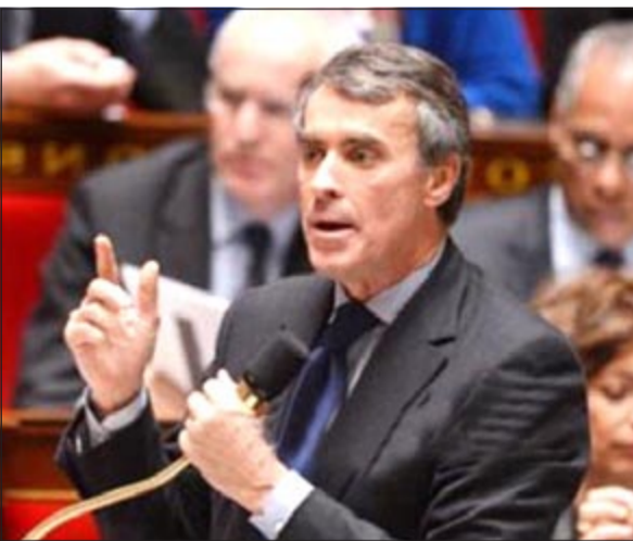
وزير المالية الفرنسي المستقيل

أكد مسبقاً أنه حصل على عمله كطبيب جراح، وأنه فتحه قبل عشرين عاماً، وهو ما تبين عدم صدقه بعد ذلك. الرئيس الفرنسي، الذي أنكر معرفته بحساب كازوك، نشر أخيراً قائمة لممتلكات وزرائه على الإنترنت، في محاولة منه لإنقاذ الصورة