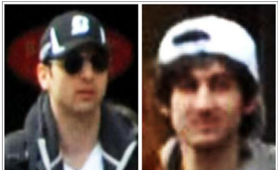
صورة مركبة للمشتبه بهما في تفجيرات بوسطن حسبما وزعها مكتب التحقيقات الفيدرالي

في الشرطة، أن اشتباكا وقع بين المسلحين وعناصر من الشرطة، قبل أن تتمكن الأخيرة من اعتقال أحدهما، فيما تمكن الآخر من الفرار. وأوصحت أن المشتبه به الذي اعتقلته توفي في عهدها، مشيرة إلى أنها عرفت عن