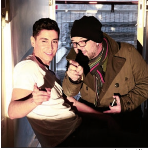
مع المخرج أحمد المهدي