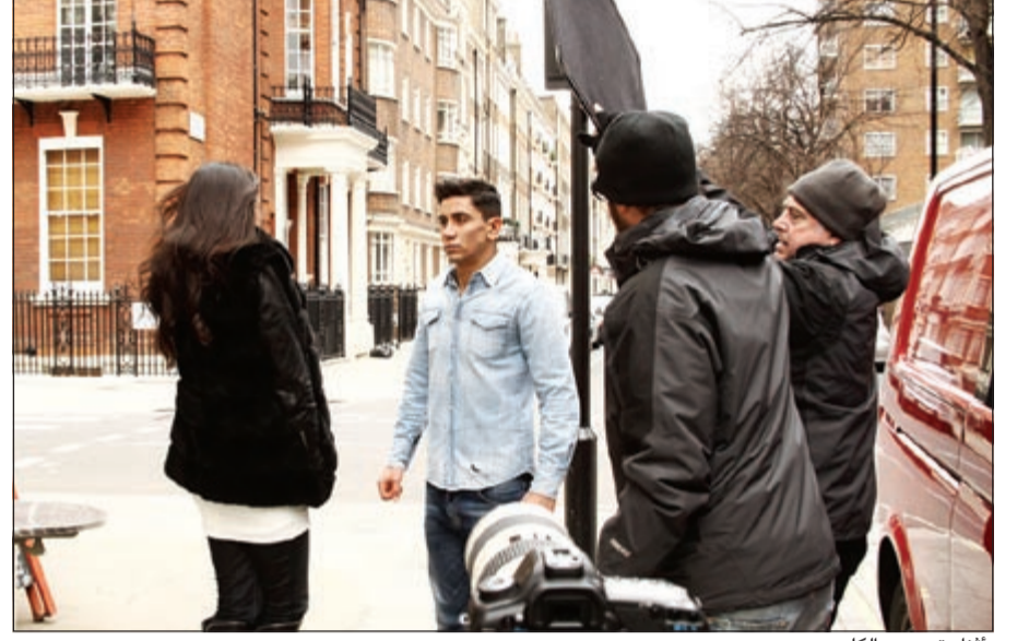
أثناء تصوير الكليب

سببت الأغنية على الإذاعات قريبا جدا وبعد القنوات الفضائية حصريا لفترة قصيرة، ثم ستوزع على كل الفضائيات العربية، حيث إن أغنية «هلبا» ستزل قبل الألبوم وستضم له فيما بعد.