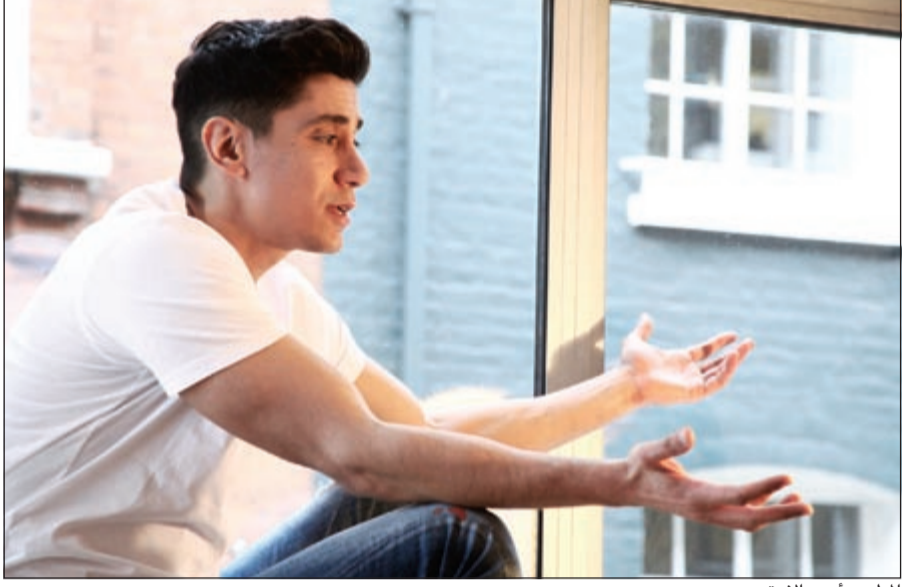
المطرب أيمن الأعر