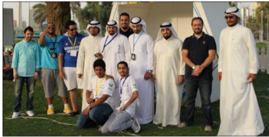
أعضاء اللجنة المنظمة