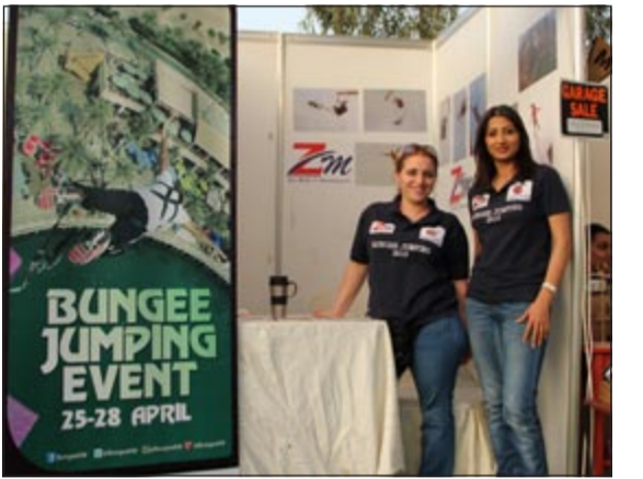
إحدى الجهات المشاركة

القطاع الخاص واعتمدوا على سواعدهم وحققوا نجاحات طيبة في سوق العمل، مشيرا إلى أن المعرض مستمر حتى الساعة العاشرة من مساء يوم السبت 20/ 4/ 2013، والدعم المعنوي الذي تلقيناه من مساعديته والذي كان له بالغ الأثر الطيب في نفوسنا ونفوس المشاركين بالمعرض وكان حافزا لنا لخروج المعرض بهذا المستوى المتميز، كما توجه بالشكر لكل من ساهم في الإعداد لهذا المعرض على مدار 100 يوم متواصل لضمان نجاحه وتحقيق أهدافه.