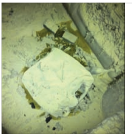
جركن الوقود الذي أقي داخل الدورية