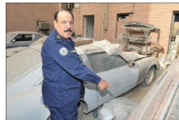
اللواء عبدالفتاح العلي يشير إلى إحدى المركبات التي يجري إصلاحها وإجراء تعديل عليها دون ترخيص

محمد الجلامه - محمد الشبيش أعلن مدير عام الإدارة العامة للمرور اللواء عبدالفتاح العلي عن إصداره تعليمات بإبعاد فوري لأي وافد تثبت قيادته لمركبة دون أن يكون حاصلا على رخصة قيادة صادرة عن