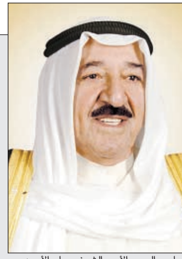
صاحب السمو الأمير الشيخ صباح الأحمد