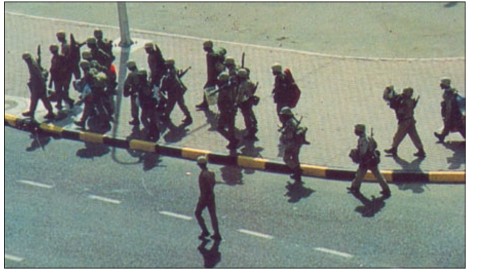
عدد من الجنود العراقيين لدى دخولهم الكويت

● بعدما وصلت الى المركز وهو بيت يجتمعون فيه ليتباحثوا في شؤون المنطقة كبقاي المناطق الأخرى وكان الدم يسيل من الفك بشكل