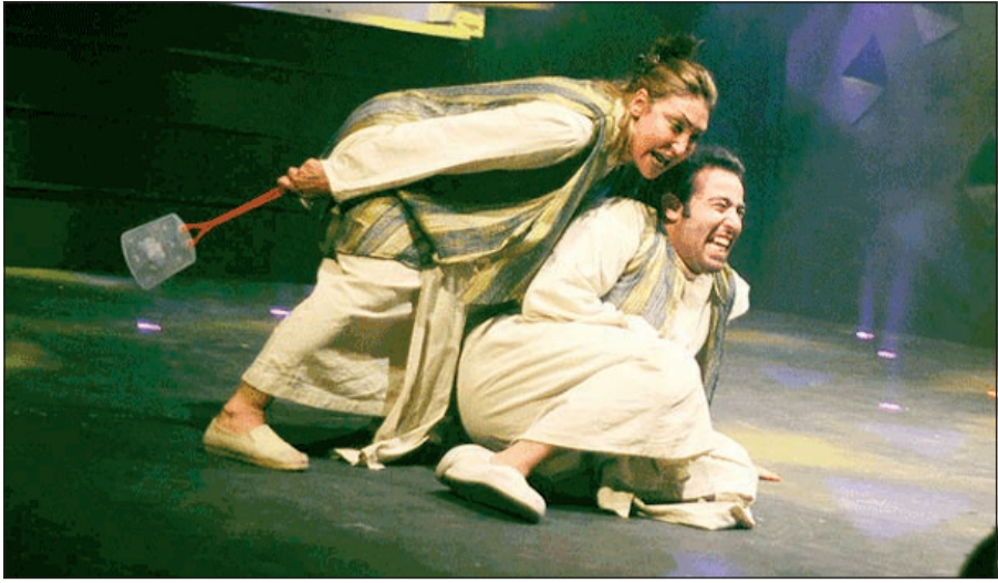
من مسرحية «على الطريق»