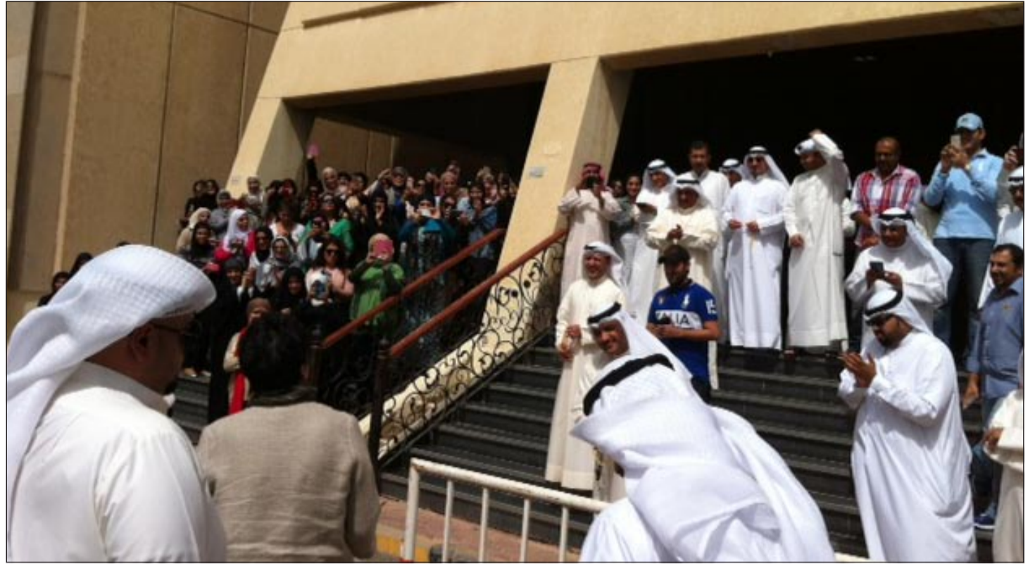
عدد كبير من موظفي الأمانة العامة للتخطيط خلال إضرابهم عن العمل