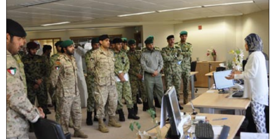
وفد الحرس يستمع إلى شرح حول آلية العمل الصحافي في «كونا»

في جولة تعريفية بإدارة الأبحاث والمعلومات، وقسم التصوير والتحرير ومكتبة الوكالة. وتعرف الوفد على دور الوكالة في تغطية الأنشطة المحلية للقادة والمؤسسات في مختلف المجالات، إضافة إلى نقل الأخبار المهمة من كافة أرجاء المعمورة عبر شبكة مميزة من المكاتب والمراسلين.