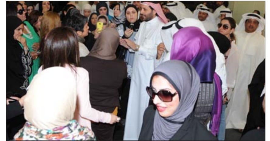
صفاء الهاشم تستمع إلى طلبات موظفي التخطيط

اليوم من قبل الموظفين، فأعطاء وزيرة التعليمات والقرارات الشفوية أمر غير مقبول. وطلبت الهاشم من الموظفين المضربين بياناً بالمشاكل والمطالب التي يريدونها وأن يمدوها بكل التفاصيل التي قد تساعدها في تحقيق مطالبهم كالهيكلة التنظيمية لقطاعات شؤون التخطيط الاستراتيجي والشؤون الإدارية وعدد كل الموظفين مع بياناتهم وتوصيف هذه القطاعات، وقالت لهم «أرجوكم احتاج هذا وبعدها اتركوا الباقي علي»، مؤكدة أن هذه المشاكل الفردية التي يعاني منها الموظفون وإذا جمعناها تصبح معاناة وزارة بالكامل، معتبرة أن وزارة التخطيط والتنمية هي القلب والعمود الفقري للدولة. وقالت الهاشم أنني أرى مواطنًا كويتيًا يحق له حقوقه في بلده ويقف في جو حار تحت وطأة الشمس لأن من يترأس الوزارة لم يكن مستمعاً جيداً». هذا، وأعلن الموظفون الذين شاركوا في الإضراب أنهم مستمرين في إضرابهم حتى تحقيق المساواة