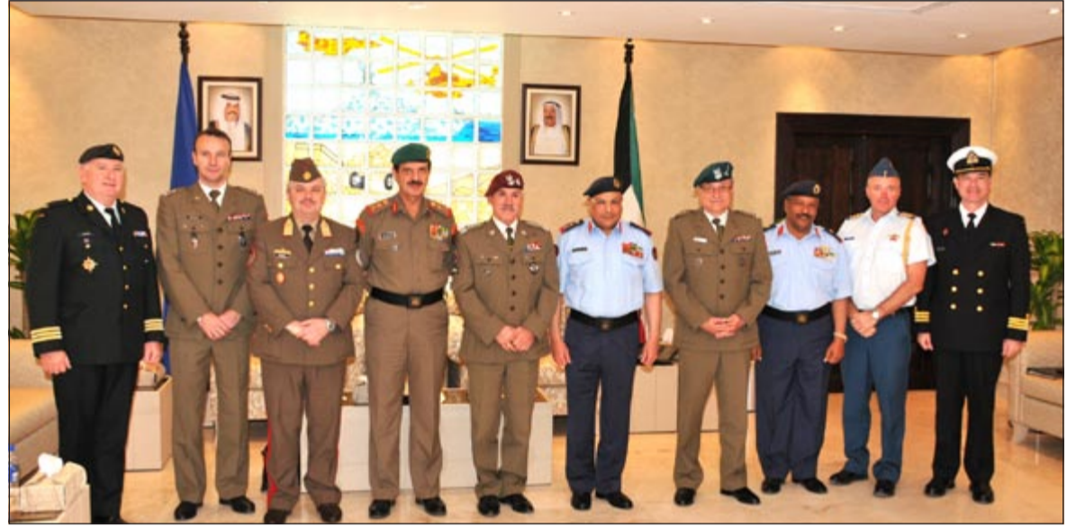
الفريق الركن خالد الجراح مستقبلاً الفريق أول ميكزيسلو بينيك والوفد المرافق له

بحث رئيس الأركان العامة للجيش الفريق الركن خالد الجراح ونائب القائد الأعلى لقوات التحويل بحلف شمال الأطلسي الفريق أول ميكزيسلو بينيك أمس موضوعات عسكرية مشتركة. وتناول اللقاء بين رئيس الأركان والفريق أول بينيك الذي رافقه نائب رئيس هيئة أركان الشراكة العسكرية للقيادة العليا لقوات التحالف الأوروبي اللواء ساندرو فاكسكو، بحث أهم الأمور والموضوعات ذات الاهتمام المشترك لإسما المتعلقة بالجوانب العسكرية وسبل تعزيزها وتطويرها بين الجانبين إضافة إلى تبادل الأحاديث الودية. حضر اللقاء الوفد المرافق