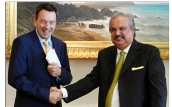
السفير ضرار رزوقي أثناء تسليم المساهمة الكويتية لـ «الصليب الأحمر»

المتضررين بشكل أساسي». وأعرب رزوقي عن أمله في تكون الخطوة الكويتية مثلاً تحذيره كافة الدول التي وعدت بتقديم مساعدات مالية إلى الشعب السوري خلال مؤتمر المانحين، كما حذر من التراخي في التعامل على المسارين السياسي والإنساني.