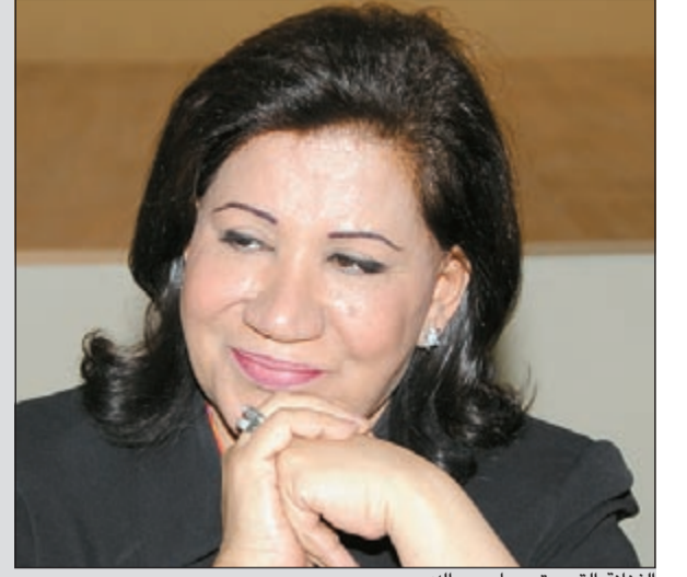
الفنانة القديرة سعاد عبدالله