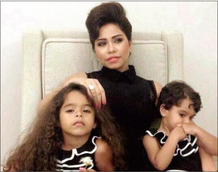
شيرين وابنتاهما بالأسود

وقعت اختيار النجمة شيرين عبدالوهاب على اللون الأسود لترتيبه في أحدث جلسة تصوير تجمعها بابنتيها مريم وهنا، وعلى الرغم من أن اللون الأسود يعتبره الكثيرون ملك الألوان، إلا أن بعضاً من محبي الفنانة المصرية استنكر اختيارها لهذا اللون نظراً لقماتمه وابتعاده عن أجواء البهجة والسرور التي ترافق صور النجوم مع أطفالهم عادة. وأثني البعض الآخر، حسب موقع «جولولي»، على لوك شيرين وابنتيها، لافتين إلى أنها إطلالة مميزة وغير تقليدية لشيرين مع مريم وهنا.