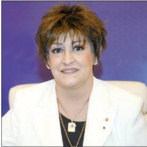
الفنانة الكبيرة الراحلة واردة

والحان بلال الزين، بسبب خلاف الأخير مع الشركة المنتجة. ولكن القرار كان يقضي بالموت خطف النجمة القديرة. وبعد وفاتها صور العمل في الجزائر وسيطلق قريبا وهو من إخراج مؤنس خمار، بعدما نشر الفيديو الدعائي له على «يوتيوب»، الذي لم تظهر فيه واردة إلا بالصوت فقط، ويضم، حسب «أيلاف»، مشاهد لآناس تمر في أذهانهم ذكريات تعني الكثير لهم.